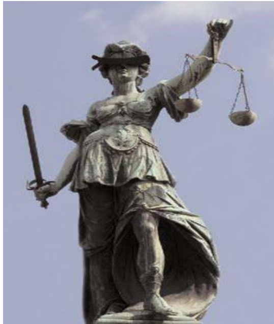
Gambar 0.2 Ilustrasi Dewi Keadilan