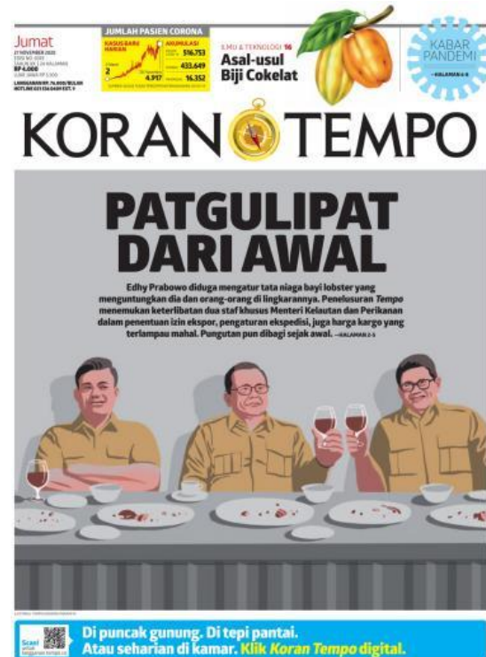
Gambar 4. Edisi 27 November 2020

bagaimana kebocoran dan penyelewengan hak negara pasti akan terungkap, dan meskipun memiliki jabatan tinggi pasti akan tertangkap juga.