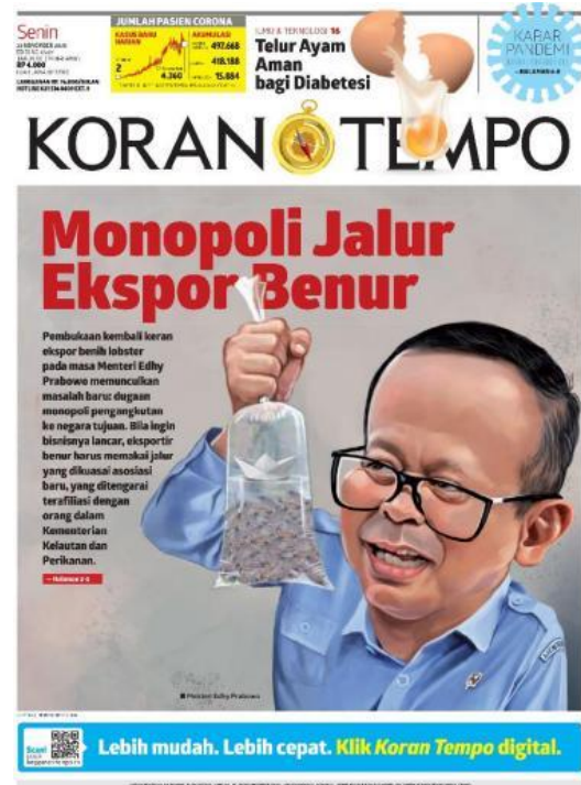
Gambar 2. Edisi 23 November 2020

bawah agar tidak mengganggu fokus utama gambar sampul.