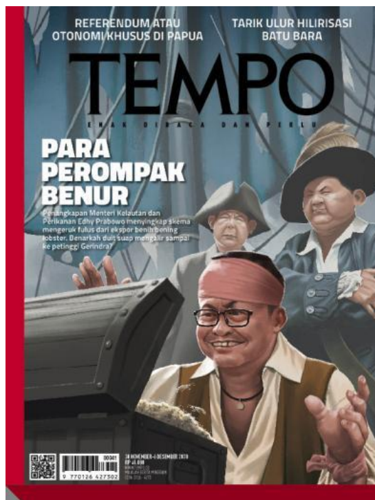
Gambar 5. Edisi 28 November 2020

sedang membuka kotak harta karun yang penuh dengan benur dan di belakangnya terdapat sosok seperti ketua partai Gerindra, Prabowo Subianto dan satu sosok lagi mereka terlihat berpakaian pejabat. Gambar di latar belakang, mengesankan adegan ini terjadi di atas kapal bajak laut. Sekilas, visualisasi ini langsung mengingatkan orang akan sebuah franchise film Hollywood berjudul ‘ Pirates of the Carribean ’. Di tengah ilustrasi terdapat teks judul ‘PARA PEROMPAK BENUR’ dan teks sub judul “Penangkapan Menteri Kelautan dan Perikanan Edhy Prabowo menyingkap skema mengeruk fulus dari ekspor benih bening lobster. Benarkah duit suap mengalir ke petinggi Gerindra?”