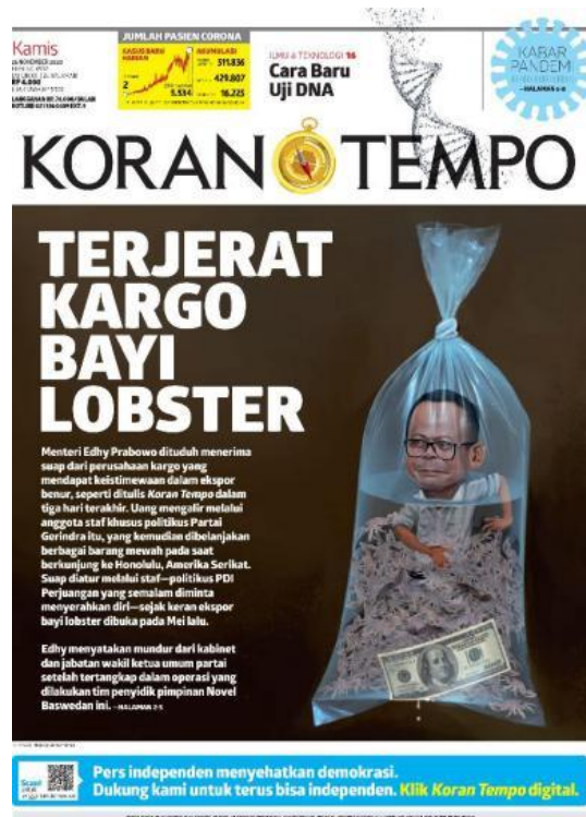
Gambar 3. Edisi 26 November 2020

Ilustrasi sampul koran Tempo edisi 26 November 2020, memiliki komponen visual image ilustrasi karikatur Edhy Prabowo di dalam kantong berisi air penuh benur. Badannya terendam air dan benur sampai bahu. Di dasar plastik terdapat selembur uang 100 dolar. Ada tetesan kecil air keluar dari plastik, posisinya di bawah uang dollar.