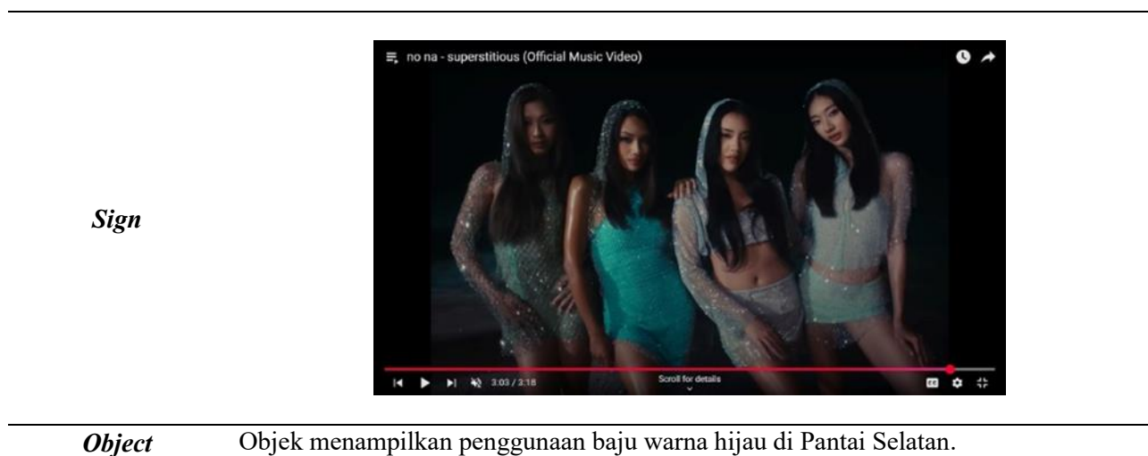
Tabel 4. Baju Hijau di Pantai Selatan

Lagu-lagu No Na Band tidak hanya membicarakan tema keberanian dan semangat perempuan muda, tetapi juga menjelajahi beberapa tema yang terkait dengan mitos dan tradisi Indonesia. Sebagai contohnya, dalam lagu "Superstitious", penggunaan kata takhayul atau mitos lokal dirancang sebagai simbol kepercayaan diri dan keteguhan. Hal ini menunjukkan bahwa tradisi Indonesia, meskipun tampaknya sudah kuno, tetap relevan dan bisa diartikan dalam konteks zaman sekarang. Mitos yang digunakan yaitu larangan memakai baju hijau di Pantai Selatan yang disampaikan dalam video musik, adalah salah satu contoh bagaimana No Na Band mengangkat cerita dan keyakinan masyarakat Indonesia, lalu menyampaikannya kepada dunia internasional.