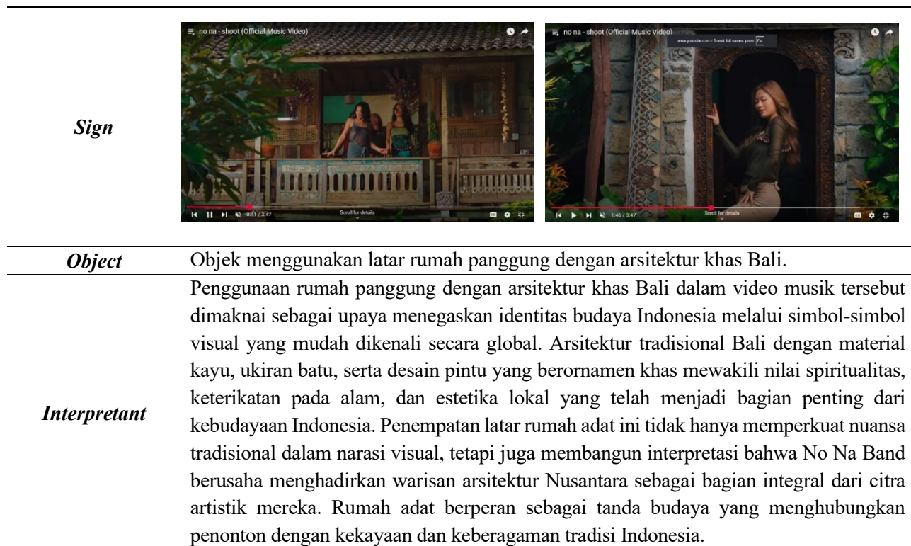
Tabel 2. Rumah Adat

Pertunjukan permainan tradisional seperti "Do Mi Kado" dan "Congklak" dalam video musik "No Na" sangat mencerminkan kekayaan budaya Indonesia, yang dapat menunjukkan kedalaman budaya lokal. Permainan domikado adalah permainan tradisional yang berasal dari Maluku dan menjadi permainan yang populer di daerah Jawa, Kalimantan, dan Sulawesi. Permainan ini biasanya dimainkan oleh sekelompok orang yang duduk bersila membentuk lingkaran dengan tangan yang saling menyambung satu sama lain. Semakin banyak orang yang ikut, maka permainan akan semakin seru (tgrcampaign.com, 2021). Cara bermain domikado: para pemain duduk membentuk lingkaran, tangan bertumpuk dan ditempatkan di atas paha. Selanjutnya, letakkan tangan kiri di bawah telapak tangan kanan pemain sebelah kiri, sementara tangan kanan ditempatkan di atas tangan kiri pemain berada di sebelah kanan.