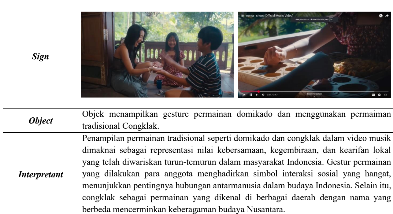
Tabel 3. Permainan Tradisional

Melalui penggunaan permainan tradisional ini bisa menunjukkan upaya untuk menonjolkan elemen budaya dalam karya mereka. Permainan tradisional ini sebagai simbol atau lebih menunjukkan suasana budaya dalam video musik tersebut. Sehingga bias membawa kearifan lokal ke panggung internasional.