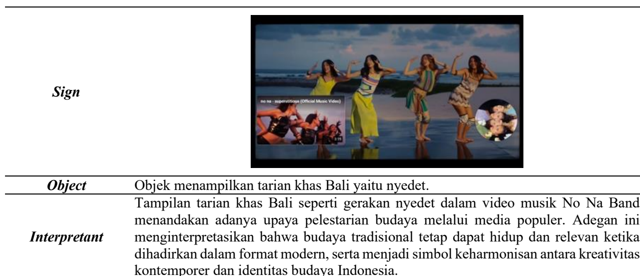
Tabel 6. Koreografi Tarian Video Musik No Na Band

Representasi ini menunjukkan bahwa meskipun No Na Band memilih gaya yang lebih modern dan pop, mereka tetap mempertahankan keaslian budaya Indonesia yang terlihat dari pilihan visual yang mereka gunakan. Pesan yang ingin disampaikan adalah bahwa kemodernan tidak selalu membuat tradisi hilang, dan keduanya bisa saling melengkapi untuk menghasilkan karya yang bisa diterima oleh penonton di berbagai belahan dunia.