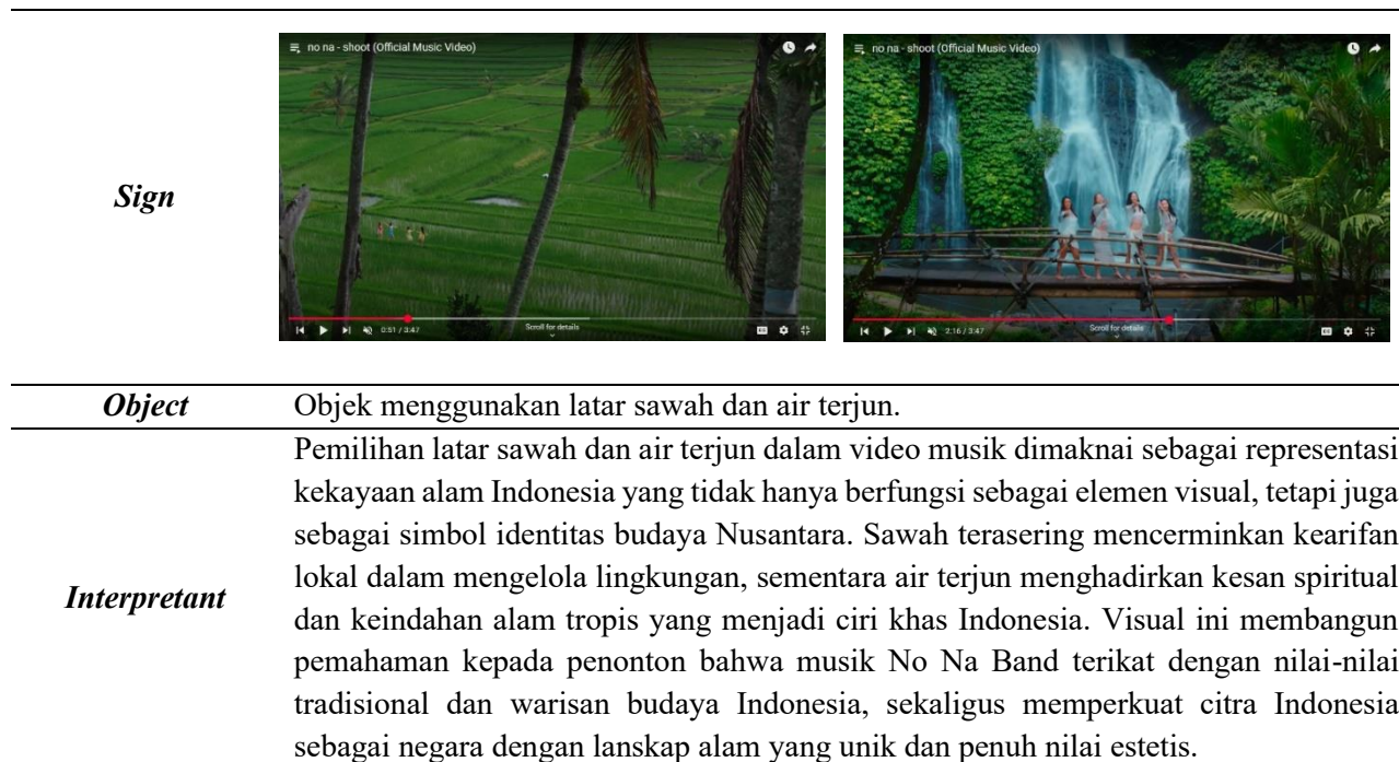
Tabel 1. Landscape Sawah dan Air Terjun Banyumala

Lokasi ikonik lain dalam MV Nona adalah Sawah Terasering Tegalalang yang berada di daerah Ubud. Pemandangan sawah yang bertingkat dengan pemandangan hijau yang luas menjadi latar yang sempurna untuk menampilkan keindahan budaya dan alam Bali dalam satu gambar. Sistem irigasi tradisional subak yang merupakan warisan budaya dunia yang diakui oleh UNESCO. Salah satu lokasi yang paling menarik di MV "Shoot" adalah Air Terjun Banyumala, yang juga dikenal oleh warga setempat sebagai Air Terjun Tirta Kuning. Lokasi ini terletak di kawasan Munduk, Bali Utara, dan menawarkan dua air terjun yang berdampingan, menciptakan pemandangan yang indah dan menenangkan (balipremiumtrip.com, 2025).