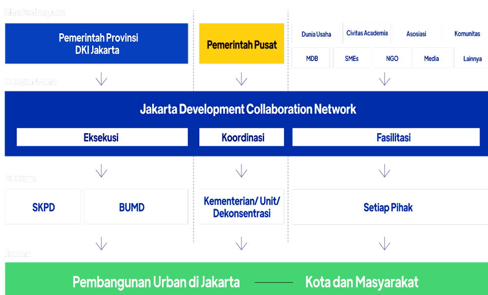
Gambar 2. Gambaran Umum Kerangka Kerja JDCN

Pemprov DKI Jakarta juga memiliki data sebaran penerima manfaat, yang basisnya berkoordinasi langsung dari masing-masing kantor Wali Kota Administrasi agar tidak ada tumpang tindih antar lembaga. Karena setiap pendistribusian bantuan oleh setiap lembaga punya fokus yang berbeda-beda. Program ini dapat terlaksanakan dengan peran Pemprov DKI Jakarta sebagai penyedia platform bukan sebagai pelaksana program-program donasi sosial. Gambaran umum kerangka kerja JDCN dapat dilihat lebih lanjut pada gambar 2.