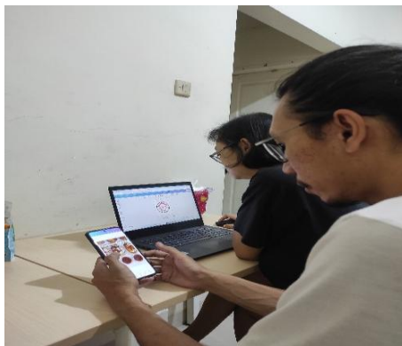
Gambar 3. Pendampingan Pembuatan dengan Canva

Gambar 2. Menunjukkan proses yang dilakukan oleh peserta pelatihan untuk membuat logo dan mendesain katalog menu makanan. Sesi ini membantu peserta mempelajari konsep fundamental dalam perancangan visual, antara lain memilih warna, tipografi dan tata telak agar mereka dapat membuat identitas merek yang menarik dan professional. Dengan logo yang lebih jelas dan katalog menu yang informatif dan menarik, hasil akhir menunjukkan peningkatan signifikan dalam kualitas desain. Selain meningkatkan kreativitas peserta proses ini mengajarkan mereka keterampilan praktis yang dapat mereka gunakan untuk memasarkan bisnis kuliner mereka. Sektor usaha kuliner termasuk salah satu bidang bisnis dengan potensi keberlanjutan yang tinggi, karena produk yang ditawarkan yakni makanan merupakan kebutuhan pokok bagi setiap orang. Jenis usaha kuliner yang dapat dikembangkan pun sangat beragam, bahkan dapat dimulai dengan modal yang relatif kecil. Keberhasilan dalam menjalankan bisnis ini bergantung pada beberapa faktor utama, antara lain kualitas cita rasa produk, mutu pelayanan, serta efektivitas strategi pemasaran yang diterapkan. (Siti Istikhoroh, DRA., M.Si., Ahmad Afifudin, Sherly Olyvia., Firdausia Fitria Putri, Irnandhita Visi Arinda, 2023)