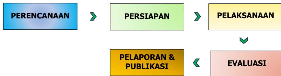
Gambar 1. Rangkaian Kegiatan Pengabdian Kepada Masyarakat

Pengabdian kepada masyarakat ini diimplementasikan melalui serangkaian kegiatan pelatihan dan pendampingan kepada pemilik usaha UMKM dalam pemanfaatan aplikasi Canva. Sosialisasi diselenggarakan pada tanggal 14 Juni 2025 di Kecamatan Pegadungan, Jakarta Barat, dengan menggunakan metode ceramah, diskusi interaktif, serta praktik langsung menggunakan aplikasi Canva. Pendekatan yang inovatif dan adaptif, seperti Model Bisnis Canvas, dapat mendukung pemahaman yang lebih mendalam terhadap karakteristik dasar suatu industri serta peran strategis yang dapat diambil oleh suatu entitas bisnis di kemudian hari. Sebagai hasilnya, penelitian ini bertujuan untuk mengeksplorasi pemanfaatan Model Bisnis Canva sebagai instrumen dalam merumuskan strategi keberlanjutan yang efektif. (Panji Pramuditha et al., 2024) Rangkaian metode pelaksanaan kegiatan tersaji lewat Gambar 1 berikut: