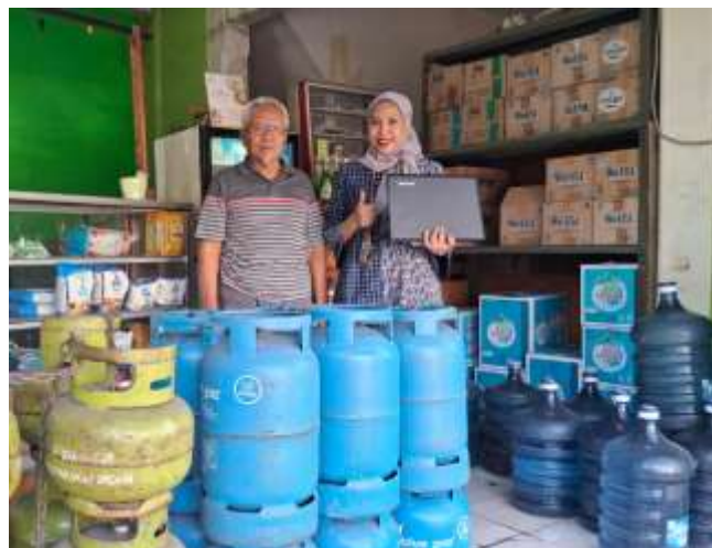
Gambar 2. Foto Kunjungan ke Toko Limus

Analisis yang baik memerlukan tidak hanya kemampuan untuk mengumpulkan informasi, tetapi juga untuk memahami apa yang data tersebut wakili dan bagaimana menggunakannya untuk mendukung keputusan yang rasional dan berbasis bukti (Setyowati et al. 2023). Analisis data penjualan merupakan langkah penting dalam memahami kinerja sebuah bisnis. Proses ini bertujuan untuk mengidentifikasi tren, pola, dan faktor yang mempengaruhi hasil penjualan, sehingga perusahaan dapat mengambil keputusan yang lebih tepat untuk meningkatkan keuntungan dan efisiensi operasional. Analisis yang baik dari data penjualan dapat memberikan wawasan yang berguna tentang pasar, pelanggan, dan produk yang harus diprioritaskan. Dalam mengatasi masalah ini, Toko Limus perlu menerapkan sistem pembukuan yang terorganisir dengan baik, salah satunya dengan penggunaan Microsoft Excel yang dapat membantu pengelolaan persediaan barang dan pengelolaan laporan keuangannya. Penggunaan Ms Excel secara maksimal mampu dapat menyelesaikan banyak masalah terkait dengan pengolahan dan analisis laporan keuangan dengan lebih efisien, akurat dan mudah dipahami dengan baik oleh pemilik toko. Bentuk pendampingan yang diberikan tertuang pada Gambar 2 dan Gambar 3.