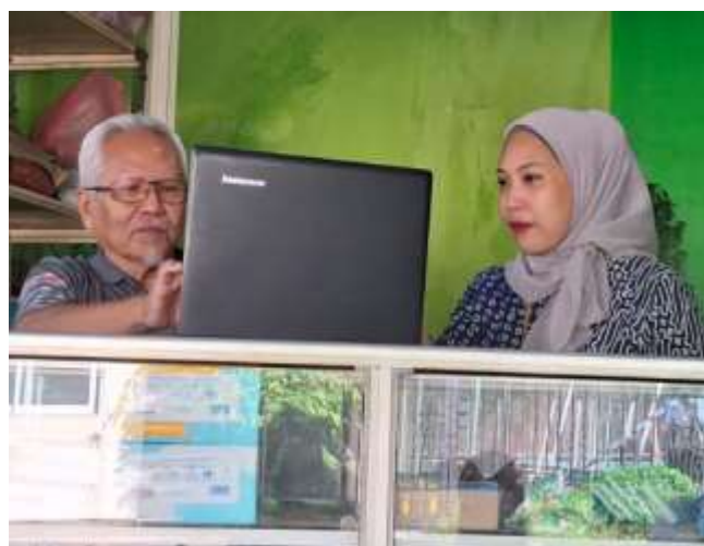
Gambar 3. Foto Kegiatan Pendampingan