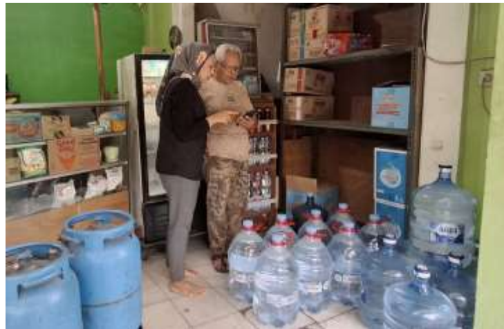
Gambar 6. Pendampingan & Pelatihan Penggunaan Aplikasi Pintar

aplikasi, sehingga dapat digunakan sebagai dasar dalam pengambilan keputusan usaha.