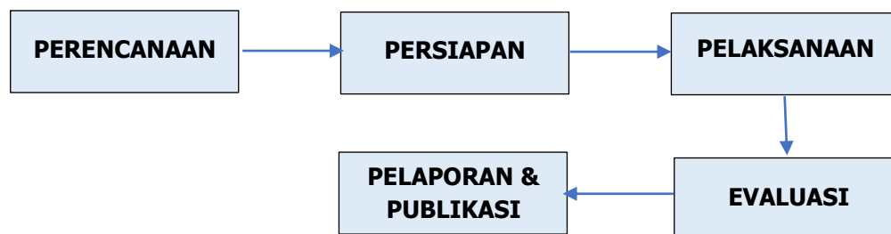
Gambar 1. Metode Pelaksanaan

Metode pelaksanaan Pengabdian Masyarakat ini dilakukan dengan pelatihan dan pendampingan dalam memperkenalkan penggunaan aplikasi Kasir Pintar pada pemilik usaha Toko Sembako. Kegiatan sosialiasi ini dilaksanakan pada 21 November 2025 di Tangerang melalui metode pelaksanaan dalam bentuk seperti terlihat pada Gambar 1. dibawah ini: