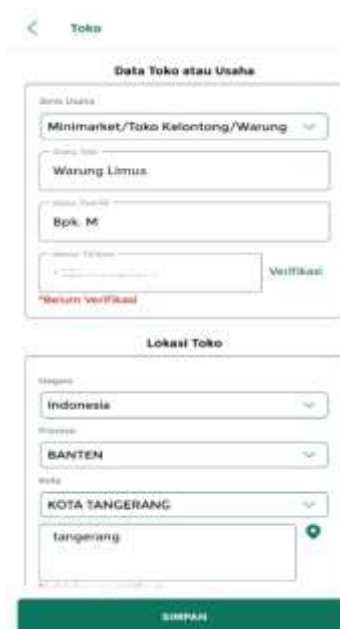
Gambar 3. Input Data Toko

Usai pendaftaran dan konfirmasi melalui email, sistem akan mengarahkan pengguna untuk melengkapi data bisnis, termasuk jenis usaha, nama usaha, serta alamat.