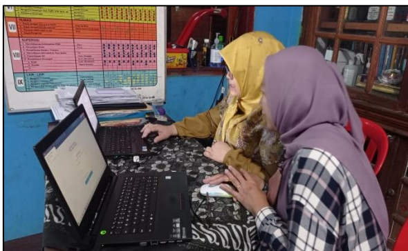
Gambar 2. Pendampingan Kegiatan

Pendampingan penggunaan website dilakukan terjadwal secara offline , dalam pendampingan ini terdiri dari 3 (tiga) sesi kegiatan yaitu diawali dengan penyampaian materi tentang pembuatan artikel yang akan di isikan berupa informasi ke dalam website hingga praktik dalam pengelolaan website dengan menyajikan tampilan website yang menarik seperti dimulai dari Login, membuat page, membuat menu, menambahkan gambar dan lainnya. Berikut ini adalah foto kegiatan pada saat pelaksanaan dan pendampingan kegiatan seperti nampak pada Gambar 2 dan Gambar 3 dibawah ini.