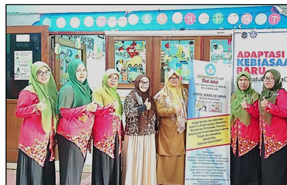
Gambar 3. Pendampingan Kegiatan