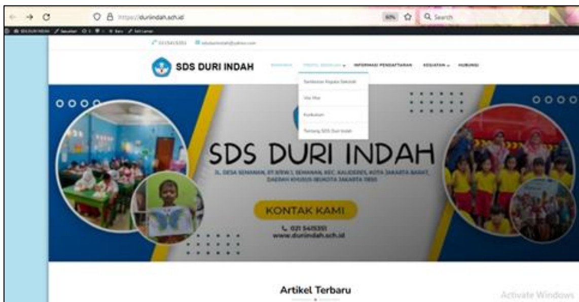
Gambar 4. Tampilan Halaman Beranda website sekolah

Berdasarkan hasil kegiatan, website yang dapat digunakan mitra yaitu website sekolah dengan alamat website http://duriindah.sch.id/ . Website tersebut memiliki berbagai informasi terkait penyebaran informasi sekolah. Berikut ini adalah menu-menu dan fitur-fitur dalam website SDS Duri Indah Jakarta.