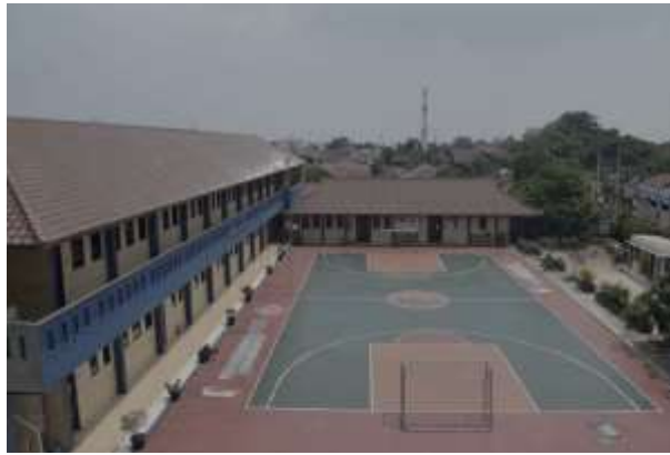
Gambar 2. Lapangan olahraga mitra

Hasil rekapitulasi Data Pokok Kemdikbud [2] pada semester genap 2023/2024, mitra memiliki siswa laki-laki sebanyak 612 orang dan siswa perempuan sebanyak 182 orang. Mitra juga memiliki Guru laki-laki sebanyak 14 orang dan Guru perempuan sebanyak 21 orang, ditambah dengan Tendik laki-laki sebanyak 9 orang dan Tendik perempuan sebanyak 9 orang.