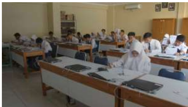
Gambar 1. Situasi ruang kelas mitra

Tampak pada Gambar 1, suasana dan situasi ruang kelas dan pada Gambar 2, tampak fasilitas lapangan olah raga yang tersedia.