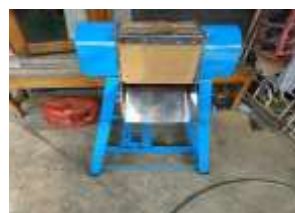
Gambar 4. Kerangka mesin dan mata pisau

Mekanisme Pamarutan Bongkahan batang sugu dimasukkan melalui bagian pemasukan (hopper), kemudian dorong menuju silinder parut dan hasil parutan akan keluar bada bagian pengeluaran. Terdapat dua mekanisme gaya pada proses pamarutan yaitu gaya dorong oleh operator dan gaya tarik karena pengaruh putaran silinder parut berlawanan jarum jam. Mesin pencacah sampah berupa sampah organik sisa rumah tangga sebagai bahan baku pembuatan biogas dapat dipindah – pindahkan. Adapun prinsip kerjanya sebagai berikut motor listrik sebagai penggerak di hubungkan pada poros penggerak dengan menggunakan media sabuk dan puli sebagai penghubung. Pada poros penggerak dipasang pisau potong. Apabila poros penggerak berputar maka pisau – pisau potong akan mencacah sampah organik. Setelah sampah tercacah, Potongan – potongan sampah tersebut akan jatuh dan dikumpulkan ke dalam wadah yang sudah disediakan. Gambar 4 merupakan kerangka mesin yang berfungsi sebagai penyangga dari mesin pencacah. Dari kerangka mesin ini akan digabungkan dengan mata pisau,. Pada bagian ini berfungsi untuk melakukan pencacaha terhadap objek sampah yang akan dijadikan sebagai bahan biogas. Antara kerangka mesin dan mata pisau kemudian digabungkan menjadi satu kesatuan mesin pencacah yang digerakan dengan motor listrik sebagai penggerak utama. Alasan menggunakan motor listrik ini supaya lebih mudah dalam operasional dan menekan biaya operasional dibandingkan dengan mesin yang menggunakan bahan bakar bensin.