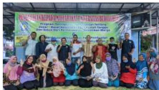
Gambar 2. Kegiatan sosialisasi penyuluhan pemisahan bahan baku biogas

Kegiatan diawali dengan mengundang seluruh warga dari kompleks tersebut kemudian dilakukan sambutan oleh ketua RT dan RW, setelah itu baru dipaparkan mengenai materi dasar pengetahuan biogas. Setelah itu ada sesi waktu tanya jawab, hal yang ditanyakan oleh warga adalah bagaimana pertama kali untuk membuat biogas. Kegiatan sosialisasi kepada warga di sajikan pada gambar 2