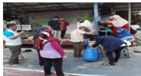
Gambar 5 . Uji coba mesin blender sampah

Setelah mesin dirakit selanjutnya mesin tersebut dilakukan pengujian secara bersama oleh peserta, dalam pengujian ini sekaligus di lakukan pelatihan untuk mengoperasikan mesin tersebut. Gambar 5. Uji coba mesin pencacah / blender sampah.