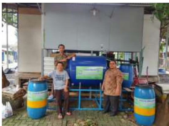
Gambar 3. Instalasi tabung reaktor biogas.

tabung khusus, terpisah dengan gas sampingan lainnya. Proses dapat dilakukan terus menerus. Misalnya proses awal berlangsung selama 5 hingga 7 hari, maka selanjutnya bahan baku sampah dapat ditambahkan berikut inokulum bakteri anaerob, dan proses berlangsung kembali. Biogas yang dihasilkan dapat terus ditambahkan/dialirkan ke dalam tabung penampung kedap udara (tanpa Oksigen). Setelah itu dapat digunakan untuk memasak dengan menggunakan kompor gas yang sudah dimodifikasi. Gambar 3. Instalasi tabung reaktor biogas.