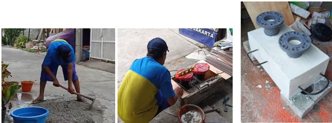
Gambar 2. Proses pembuatan pondasi pompa hidram

Setelah pondasi pompa hidram cukup kuat dan proses pengeringan sempurna lalu dilakukan instalasi pompa hidram dilokasi yang sudah ditentukan. Lokasi pemasangan pompa hidram telah disurvei terlebih dahulu. Lokasi tersebut harus berada ditempat yang benar-benar dibutuhkan dengan ketinggian yang memadai dan curah air hujan yang cukup deras (Risaldi, 2022). Proses instalasi seperti pada Gambar 3. berikut;