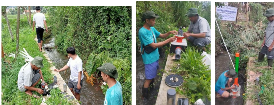
Gambar 3. Proses instalasi pompa hidram

Setelah pondasi pompa hidram cukup kuat dan proses pengeringan sempurna lalu dilakukan instalasi pompa hidram dilokasi yang sudah ditentukan. Lokasi pemasangan pompa hidram telah disurvei terlebih dahulu. Lokasi tersebut harus berada ditempat yang benar-benar dibutuhkan dengan ketinggian yang memadai dan curah air hujan yang cukup deras (Risaldi, 2022). Proses instalasi seperti pada Gambar 3. berikut;