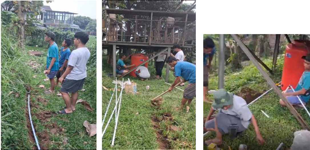
Gambar 4 Instalasi saluran air

Pada bagian bawah tandon telah dipasang keran untuk mengalirkan air. Aliran air yang cukup deras membuat tandon cepat terisi oleh air hasil pompa hidran yang telah dipasang (Nurrochmad, 2017).