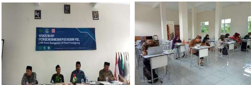
Gambar 2.33. Dokumentasi Kegiatan Forum Group Discussion (FGD) di SMK Al Falah Pandeglang

Hari/Tanggal : Selasa-Rabu, 14-15 September 2021 Jam : 09:00 s/d 11:30 WIB Lokasi : SMK Al Falah Pandeglang Peserta : Daftar Presensi terlampir