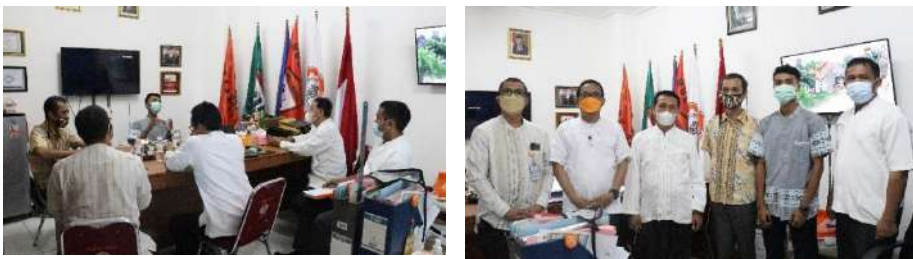
Gambar 2.18. Dokumentasi Kegiatan Silaturahmi dan Sosialisasi Kegiatan Pendampingan SMKPK di SMK Muhammadiyah 3 Tangerang Selatan

Dari hasil pertemuan ini disepakati untuk kegiatan pendampingan akan dilakukan 2 kali dalam seminggu menggunakan sistem tatap muka (luring)