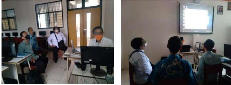
Gambar 2.9. Dokumentasi Kegiatan Pendampingan Project Based Learning di SMK Muhammadiyah 3 Tangerang Selatan

Dari hasil review kegiatan program Project Based Learning di SMK Muhammadiyah 3 diketahui informasi program project based learning sudah dimasukkan kedalam kurikulum dan peta jalan SMK Muhammadiyah 3. Kegiatan project based learning yang sudah berjalan saat ini berupa kerjasama dan pelatihan produksi film dengan MUTV.