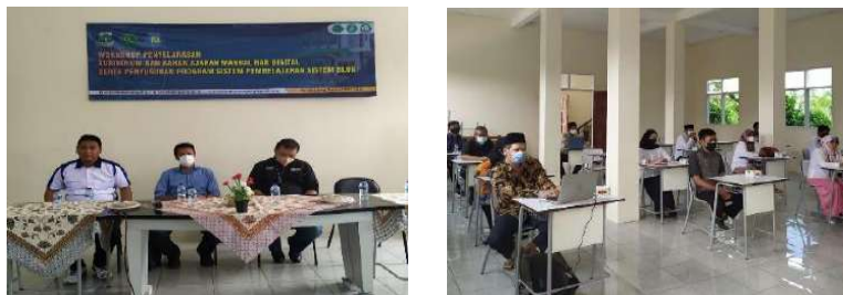
Gambar 2.25. Pendampingan Magang Guru di SMK PK Al Falah Pandeglang

Berdasarkan penjabaran dan pengembangan Instrumen Modul Ajar (Perangkat Ajar) didapati Modul Ajar untuk Mata Pelajaran Bisnis Daring Pemasaran harus