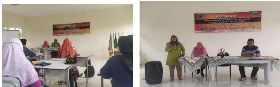
Gambar 2.24. Kegiatan pendampingan KOS di SMK Al Falah Pandeglang

Berdasarkan Instrumen Verifikasi/Validasi KOS SMK Pusat Keunggulan tahun 2020/2021 didapat skoring akhir 47/100. Hal ini menunjukkan KOS yang ada di SMK pendamping diperlukan penyempurnaan. Berikut ini merupakan verifikasi Instrumen KOS di SMK Al Falah, Pandeglang: