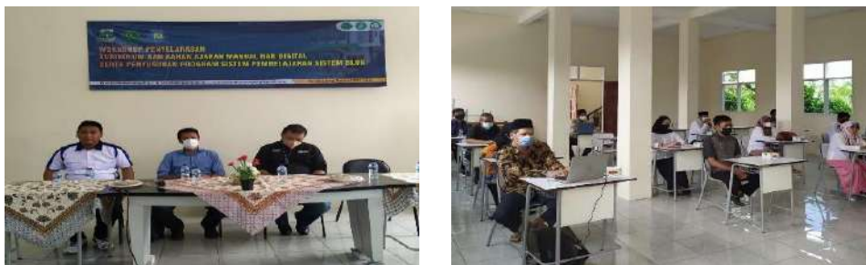
Gambar 2.12. Pendampingan Magang Guru di SMK Al Falah Pandeglang