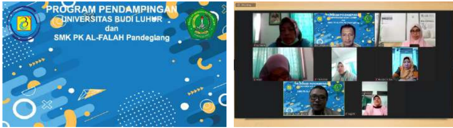
Gambar 2.34. Sosialisasi Kegiatan Pendampingan SMK Pusat Keunggulan melalui system tatap virtual (daring) zoom meeting .

Kegiatan Silaturahmi dan Sosialisasi Kegiatan Pendampingan SMK Pusat Keunggulan telah dilaksanakan pada: