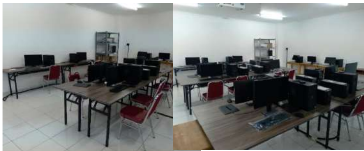
Gambar 2.19. Dokumentasi Kegiatan Survey Fisik dan Pengadaan Peralatan di SMK Muhammadiyah 3 Tangerang Selatan

Dari hasil survey/ kunjungan diketahui bahwa penggunaan dana bantuan dilakukan untuk pengadaan perangkat komputer untuk kegiatan praktik dan dengan proposal yang disetujui.