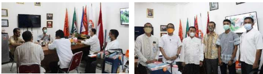
Gambar 2.18. Dokumentasi Kegiatan Silaturahmi dan Sosialisasi Kegiatan Pendampingan SMKPK di SMK Muhammadiyah 3 Tangerang Selatan

Dari hasil pertemuan ini disepakati untuk kegiatan pendampingan akan dilakukan 2 kali dalam seminggu menggunakan sistem tatap muka (luring)