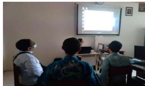
Gambar 2.9. Dokumentasi Kegiatan Pendampingan Project Based Learning di SMK Muhammadiyah 3 Tangerang Selatan