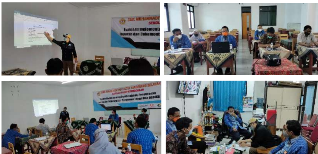
Gambar 2.21. Dokumentasi Kegiatan Pendampingan Monev Kemendikbudristek di SMK Muhammadiyah 3 Tangerang Selatan