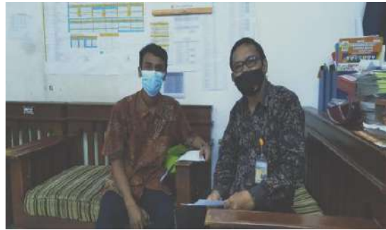
Gambar 2.8. Dokumentasi Kegiatan Pendampingan Sertifikasi Guru di SMK Muhammadiyah 3 Tangerang Selatan