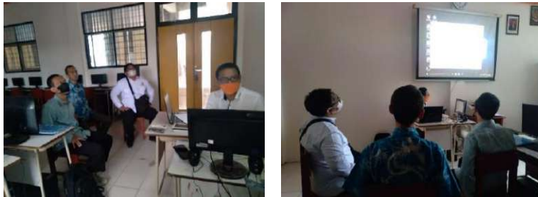
Gambar 2.9. Dokumentasi Kegiatan Pendampingan Project Based Learning di SMK Muhammadiyah 3 Tangerang Selatan

Dari hasil review kegiatan program Project Based Learning di SMK Muhammadiyah 3 diketahui informasi program project based learning sudah dimasukkan kedalam kurikulum dan peta jalan SMK Muhammadiyah 3. Kegiatan project based learning yang sudah berjalan saat ini berupa kerjasama dan pelatihan produksi film dengan MUTV.