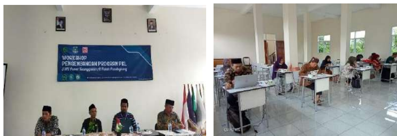
Gambar 2.33. Dokumentasi Kegiatan Forum Group Discussion (FGD) di SMK Al Falah Pandeglang

Hari/Tanggal : Selasa-Rabu, 14-15 September 2021 Jam : 09:00 s/d 11:30 WIB Lokasi : SMK Al Falah Pandeglang Peserta : Daftar Presensi terlampir