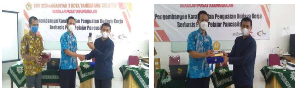
Gambar 2.23. Dokumentasi Kegiatan Pendampingan Laporan dan Penutupan Kegiatan Pendampingan SMKPK di SMK Muhammadiyah 3 Tangerang Selatan