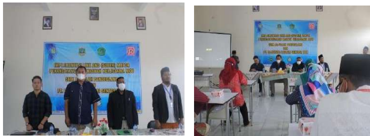
Gambar 2.27. Dokumentasi Kegiatan Pendampingan Teaching Factory (TEFA), di SMK Al Falah Pandeglang

Kegiatan TEFA yang sudah berjalan saat ini berupa kerjasama dan pelatihan praktik pemasaran bersama PT. Ramayana Lestari Sentosa Tbk. Hasil dari kegiatan pendampingan ini pihak sekolah akan lebih fokus menentukan pengembangan terkait bidang ilmu bisnis daring pemasaran (BDP). Sekolah akan menyediakan