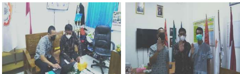
Gambar 2.3. Dokumentasi Kegiatan Pendampingan Jadwal Sistem Blok di SMK Muhammadiyah 3 Tangerang Selatan

Hari/Tanggal : Kamis/21 Oktober 2021 Jam : 09:00 s/d 11:30 WIB Lokasi : SMK Muhammadiyah 3 Tangerang Selatan