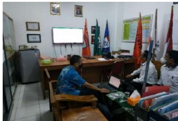
Gambar 2.2. Dokumentasi Kegiatan Pendampingan Modul Perangkat Ajar di SMK Muhammadiyah 3 Tangerang Selatan