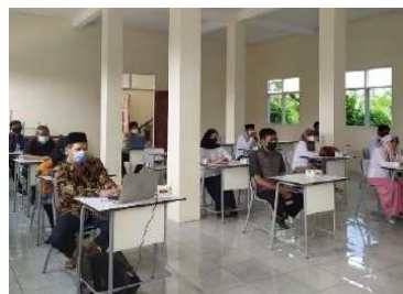
Gambar 2.25. Pendampingan Magang Guru di SMK PK Al Falah Pandeglang

Berdasarkan penjabaran dan pengembangan Instrumen Modul Ajar (Perangkat Ajar) didapati Modul Ajar untuk Mata Pelajaran Bisnis Daring Pemasaran harus