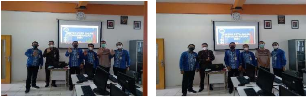
Gambar 2.10. Dokumentasi Kegiatan Pendampingan Peta Jalan ( Road Map ) di SMK Muhammadiyah 3 Tangerang Selatan