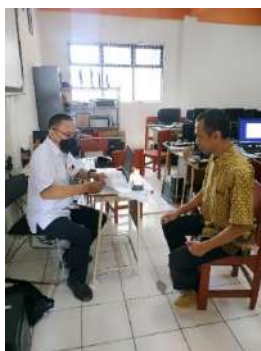
Gambar 2.15. Dokumentasi Kegiatan Sosialisasi Why Education Failed di SMK Muhammadiyah 3 Tangerang Selatan

Hari/Tanggal : Jumat/ 03 Desember 2021 Jam : 09:00 s/d 11:30 WIB Lokasi : SMK Muhammadiyah 3 Tangerang Selatan