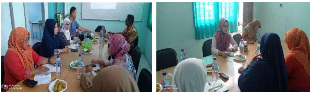
Gambar 2.18. Dokumentasi Kegiatan Pendampingan Peta Jalan ( Road Map ) di SMK Al Falah, Pandeglang