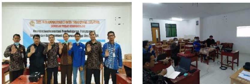
Gambar 2.5. Dokumentasi Kegiatan Pendampingan Teaching Factory (TEFA) di SMK Muhammadiyah 3 Tangerang Selatan