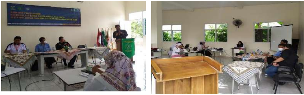
Gambar 2.13. Kegiatan pendampingan Jadwal Sistem Blok di SMK Al Falah Pandeglang