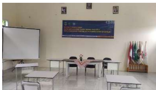
Gambar 2.36. Dokumentasi Kegiatan Survey Fisik dan Pengadaan Peralatan, di SMK Al Falah Pandeglang

Dari hasil survey/kunjungan diketahui penggunaan dana bantuan untuk pengadaan perangkat alat ajar di sekolah untuk kegiatan praktik belum diperlukan penambahan peralatan. Karena kebutuhan peralatan yang telah dimiliki oleh SMK Al Falah Pandeglang, telah terpenuhi saat SMK PK Al Falah mengikuti program Sekolah CoE.