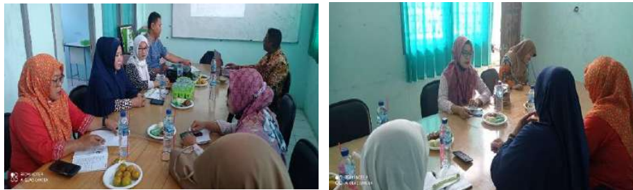
Gambar 2.31. Dokumentasi Kegiatan Pendampingan Peta Jalan ( Road Map ) di SMK Al Falah, Pandeglang

Lengkapi dengan dokumen lampiran sesuai format Peta Jalan