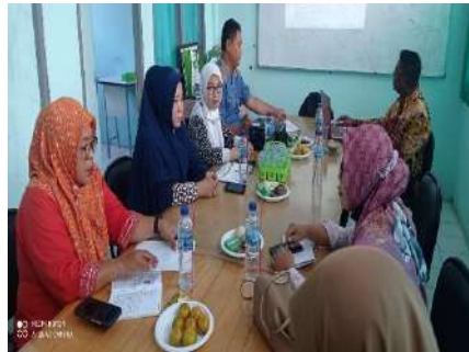
Gambar 2.37. Dokumentasi Kegiatan Pendampingan Monalisa di SMK Al Falah Pandeglang

Dari hasil kegiatan Pendampingan Monalisa di SMK Al Falah Pandeglang dana bantuan dapat diterima dan digunakan sesuai waktu yang telah ditentukan.