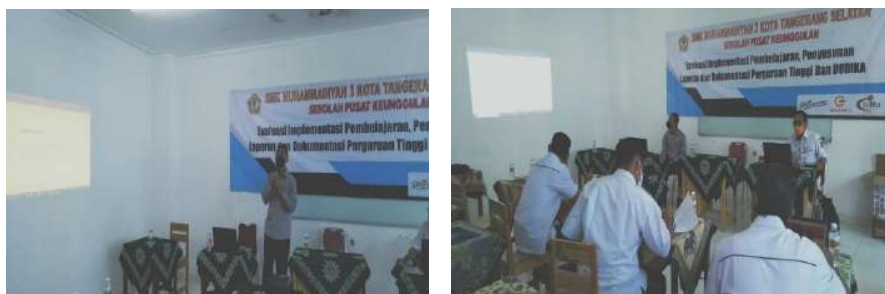
Gambar 2.1. Dokumentasi Kegiatan Pendampingan Kurikulum Operasional di Satuan Pendidikan (KOS) di SMK Muhammadiyah 3 Tangerang Selatan

Berdasarkan Instrumen Verifikasi/ Validasi KOS SMK Pusat Keunggulan tahun 2020/2021 didapat skoring akhir 45/100. Hal ini menunjukkan KOS yang ada di SMK pendamping perlu penyempurnaan Berikut hasil verifikasi Instrumen KOS di SMK Muhammadiyah 3 Tangerang Selatan: