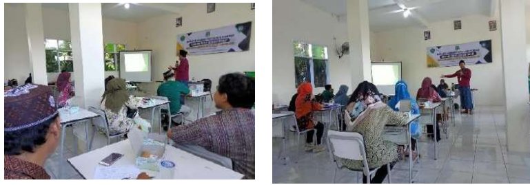
Gambar 2.28. Kegiatan pendampingan Magang Guru, di SMK PK Al Falah, Pandeglang

Dari hasil daftar peserta didik yang ada di SMK Al Falah Pandeglang (dokumen terlampir) diketahui informasi sebanyak 3 (empat) guru di SMK Al Falah Pandeglang telah mengikuti kegiatan magang. Kegiatan magang dilaksanakan di lembaga penyelenggara yang memiliki kerjasama diantaranya Ramayana dan Alfa Mart. Bagi guru yang belum mengikuti magang kami merekomendasikan untuk ikut dan diberi kesempatan mengikuti program magang sehingga seluruh guru mampu meningkatkan kompetensinya.