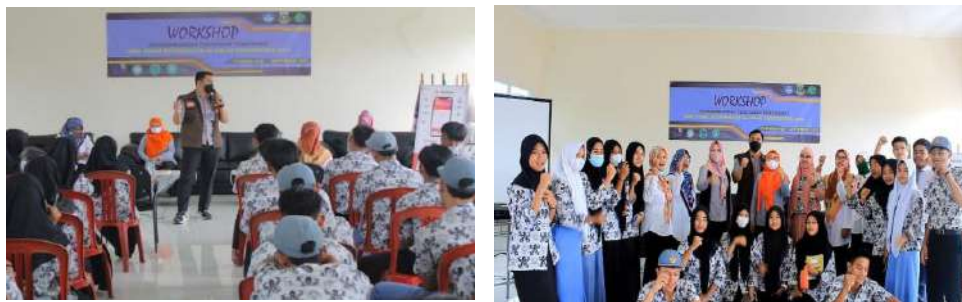
Gambar 2.17. Dokumentasi Kegiatan Pendampingan Project Based Learning di SMK Al Falah Pandeglang