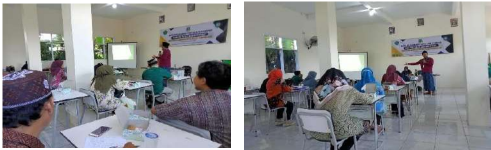
Gambar 2.15. Kegiatan pendampingan Magang Guru, di SMK PK Al Falah, Pandeglang