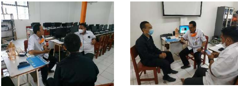
Gambar 2.7. Dokumentasi Kegiatan Pendampingan Magang Guru di SMK Muhammadiyah 3 Tangerang Selatan

Hari/Tanggal : Senin/08 November 2021 Jam : 09:00 s/d 11:30 WIB Lokasi : SMK Muhammadiyah 3 Tangerang Selatan