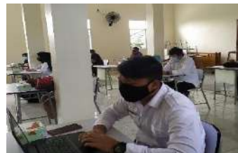
Gambar 2.38. Dokumentasi Kegiatan Workshop Penelusuran Alumni di SMK Al Falah Pandeglang