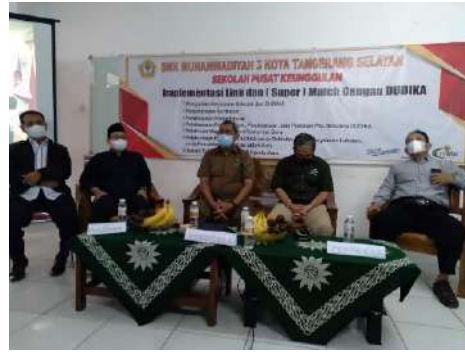
Gambar 2.4. Dokumentasi Kegiatan Pendampingan dan Workshop Implementasi Penguatan Link n Super Match di SMK Muhammadiyah 3 Tangerang Selatan