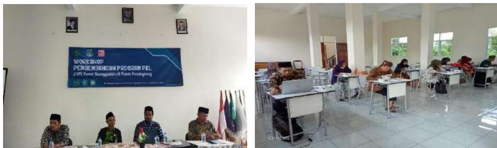
Gambar 2.20. Dokumentasi Kegiatan Forum Group Discussion (FGD) di SMK Al Falah Pandeglang