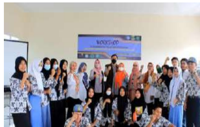
Gambar 2.30. Dokumentasi Kegiatan Pendampingan Project Based Learning di SMK Al Falah Pandeglang

Dari hasil review kegiatan program Project Based Learning di SMK Al Falah Pandeglang, sudah dimasukkan kedalam kurikulum dan peta jalan sekolah. Kegiatan project based learning yang sudah berjalan saat ini berupa kerjasama dan pelatihan manajemen pemasaran bersama Ramayana.