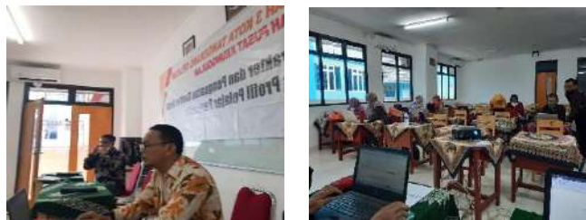
Gambar 2.17. Dokumentasi Kegiatan Sosialisasi Asesmen Formatif dan Asesmen Sumatif di SMK Muhammadiyah 3 Tangerang Selatan

Hari/Tanggal : Sabtu/ 11 Desember 2021 Jam : 09:00 s/d 11:30 WIB Lokasi : SMK Muhammadiyah 3 Tangerang Selatan