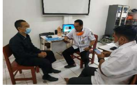
Gambar 2.7. Dokumentasi Kegiatan Pendampingan Magang Guru di SMK Muhammadiyah 3 Tangerang Selatan