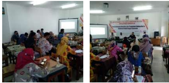
Gambar 2.16. Dokumentasi Kegiatan Sosialisasi Gerakan Sekolah Menyenangkan di SMK Muhammadiyah 3 Tangerang Selatan