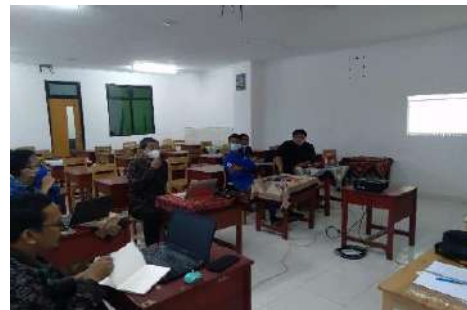
Gambar 2.5. Dokumentasi Kegiatan Pendampingan Teaching Factory (TEFA) di SMK Muhammadiyah 3 Tangerang Selatan