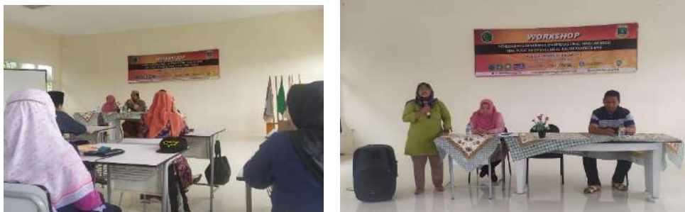
Gambar 2.11. Kegiatan pendampingan KOS di SMK Al Falah Pandeglang