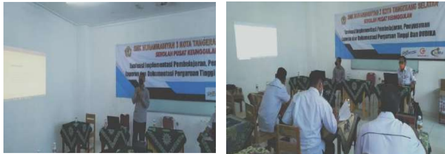
Gambar 2.1. Dokumentasi Kegiatan Pendampingan Kurikulum Operasional di Satuan Pendidikan (KOS) di SMK Muhammadiyah 3 Tangerang Selatan