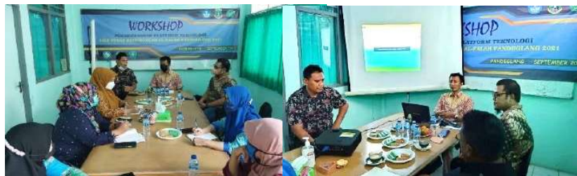
Gambar 2.32. Dokumentasi Kegiatan Pendampingan Platform Teknologi di SMK Al Falah Pandeglang

Dari hasil review kegiatan Platform Teknologi di SMK Al Falah Pandeglang diketahui informasi sebagai berikut: Baik kepala sekolah, guru dan peserta didik telah mengetahui pentingnya platform teknologi dalam proses pendidikan. Sehingga keinginan untuk maju dalam menerapkan platform teknologi, sudah menjadi keinginan stakeholder sekolah.