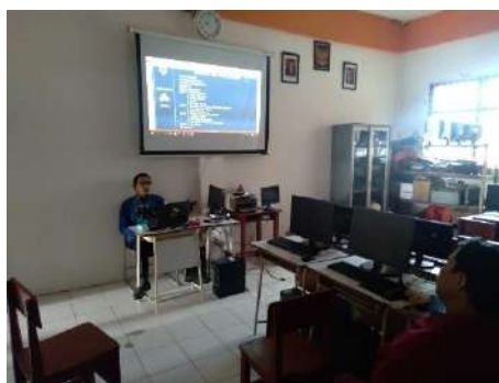
Gambar 2.14. Dokumentasi Kegiatan Sosialisasi Tata Kelola BLUD di SMK Muhammadiyah 3 Tangerang Selatan

Hari/Tanggal : Senin/29 November 2021 Jam : 09:00 s/d 11:30 WIB Lokasi : SMK Muhammadiyah 3 Tangerang Selatan