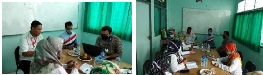
Gambar 2.35. Dokumentasi Kegiatan Silaturahmi dan Sosialisasi Kegiatan Pendampingan di SMK PK Al Falah Pandeglang

Dari hasil pertemuan ini disepakati untuk kegiatan pendampingan akan dilakukan 2 kali dalam seminggu menggunakan sistem tatap muka (luring)