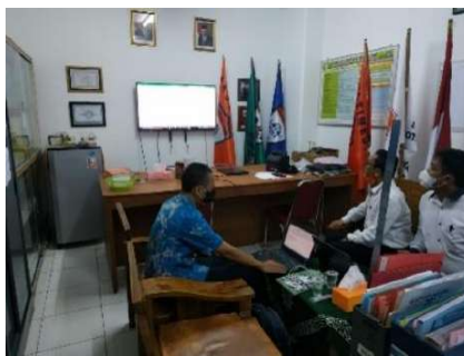
Gambar 2.2. Dokumentasi Kegiatan Pendampingan Modul Perangkat Ajar di SMK Muhammadiyah 3 Tangerang Selatan

Berdasarkan Instrumen QC Modul Ajar (Perangkat Ajar) disimpulkan Modul Ajar untuk Mata Pelajaran Jaringan Nirkabel perlu disempurnakan pada bagian kelengkapan Modul. Berikut hasil verifikasi Instrumen QC Modul Ajar (Perangkat Ajar) di SMK Muhammadiyah 3 Tangerang Selatan: