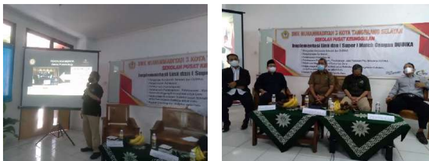
Gambar 2.4. Dokumentasi Kegiatan Pendampingan dan Workshop Implementasi Penguatan Link n Super Match di SMK Muhammadiyah 3 Tangerang Selatan

Hari/Tanggal : Senin/25 Oktober 2021 Jam : 09:00 s/d 16:00 WIB Lokasi : SMK Muhammadiyah 3 Tangerang Selatan