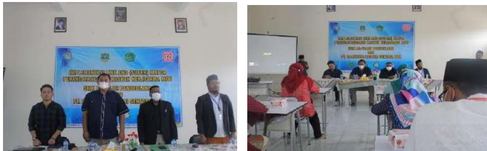
Gambar 2.14. Dokumentasi Kegiatan Pendampingan Teaching Factory (TEFA) , di SMK Al Falah Pandeglang