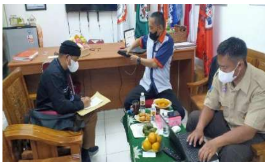
Gambar 2.22. Dokumentasi Kegiatan Pendampingan Monev II Kemendikbudristek di SMK Muhammadiyah 3 Tangerang Selatan

Hari/Tanggal : Selasa-Rabu/ 30 November sd 01 Desember 2021 Jam : 09:00 s/d 11:30 WIB Lokasi : SMK Muhammadiyah 3 Tangerang Selatan