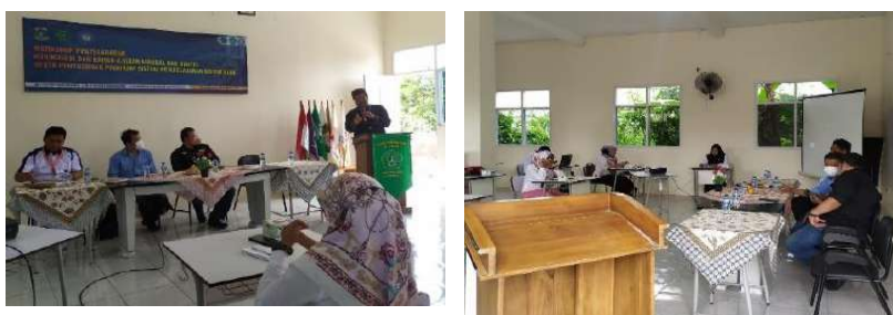
Gambar 2.26. Kegiatan pendampingan Jadwal Sistem Blok di SMKPK Al Falah, Pandeglang.

Berdasarkan verifikasi dokumen Jadwal Sistem Blok MM SMK Pendamping didapatkan informasi bahwa Jadwal Sistem Blok SMK Pendamping telah mengakomodir/menunjang konsep pembelajaran Teaching Factory (TEFA) ataupun P5BK yang menggabungkan teori dengan praktik kerja.