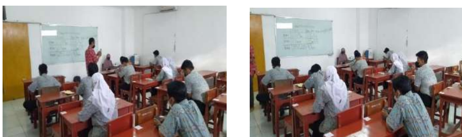
Gambar 2.11. Dokumentasi Kegiatan Pendampingan Platform Teknologi di SMK Muhammadiyah 3 Tangerang Selatan

Lokasi : SMK Muhammadiyah 3 Tangerang Selatan