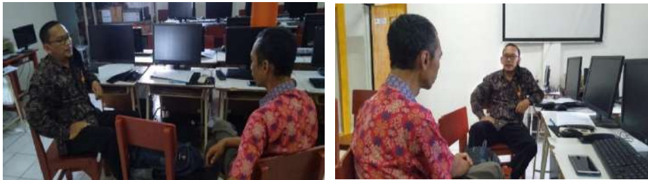
Gambar 2.12. Dokumentasi Kegiatan Pendampingan Monev di SMK Muhammadiyah 3 Tangerang Selatan

Hari/Tanggal : Selasa/23 November 2021 Jam : 09:00 s/d 11:30 WIB Lokasi : SMK Muhammadiyah 3 Tangerang Selatan