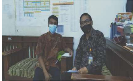
Gambar 2.8. Dokumentasi Kegiatan Pendampingan Sertifikasi Guru di SMK Muhammadiyah 3 Tangerang Selatan

Hari/Tanggal : Selasa/09 November 2021 Jam : 09:00 s/d 11:30 WIB Lokasi : SMK Muhammadiyah 3 Tangerang Selatan