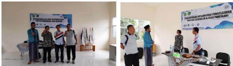
Gambar 2.39. Dokumentasi Kegiatan Pendampingan Monitoring dan Evaluasi dari pendamping nasional Kementerian Pendidikan Kebudayaan Riset dan Teknologi, di SMK Al Falah Pandeglang, Banten.

Hasil penilaian Monev di SMK Al Falah Pandeglang menyimpulkan bahwa kelengkapan dokumen terkait Program SMKPK dan kesesuaian serta kelengkapan administrasi penggunaan dana bantuan SMK PK SESUAI .