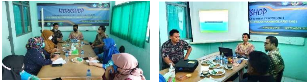
Gambar 2.19. Dokumentasi Kegiatan Pendampingan Platform Teknologi di SMK Al Falah Pandeglang