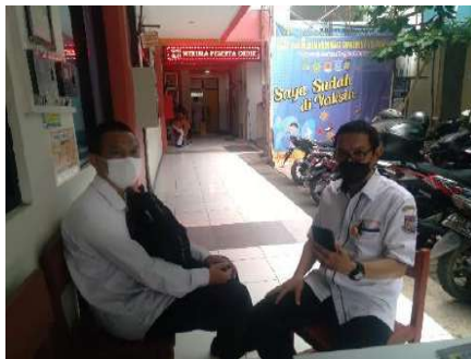
Gambar 2.6. Dokumentasi Kegiatan Pendampingan Coaching dan Asesmen di SMK Muhammadiyah 3 Tangerang Selatan

Hari/Tanggal : Senin/01 November 2021 Jam : 09:00 s/d 11:30 WIB Lokasi : SMK Muhammadiyah 3 Tangerang Selatan