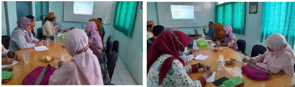
Gambar 2.16. Dokumentasi Kegiatan Pendampingan Sertifikasi Guru di SMK Al Falah Pandeglang