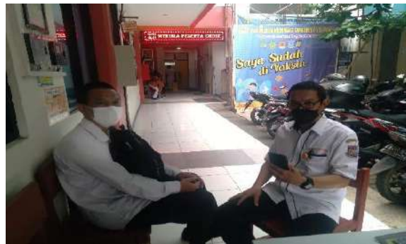
Gambar 2.6. Dokumentasi Kegiatan Pendampingan Coaching dan Asesmen di SMK Muhammadiyah 3 Tangerang Selatan