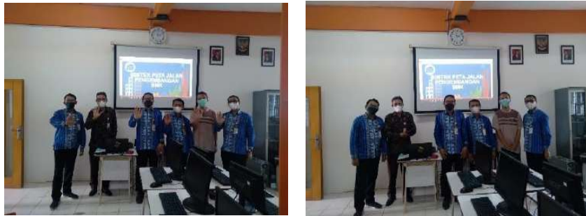
Gambar 2.10. Dokumentasi Kegiatan Pendampingan Peta Jalan ( Road Map ) di SMK Muhammadiyah 3 Tangerang Selatan