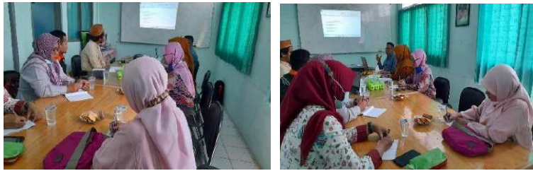
Gambar 2.29. Dokumentasi Kegiatan Pendampingan Sertifikasi Guru di SMK Al Falah Pandeglang

Dari hasil daftar peserta didik yang ada di SMK Al Falah Pandeglang (dokumen terlampir) diketahui informasi sebanyak tiga guru (15%) dari total 20 guru di SMK Al Falah Pandeglang telah mengikuti kegiatan sertifikasi. Kegiatan sertifikasi dilaksanakan oleh lembaga penyelenggara yang memiliki kompetensi dibidangnya diantaranya Kemendikbudristek, BPPPMVP Hospitality dan PT. Ramayana Tbk. Bagi guru yang belum mengikuti kegiatan sertifikasi kami merekomendasikan untuk ikut dan diberi kesempatan mengikuti program sertifikasi sehingga seluruh guru mampu meningkatkan kompetensinya.