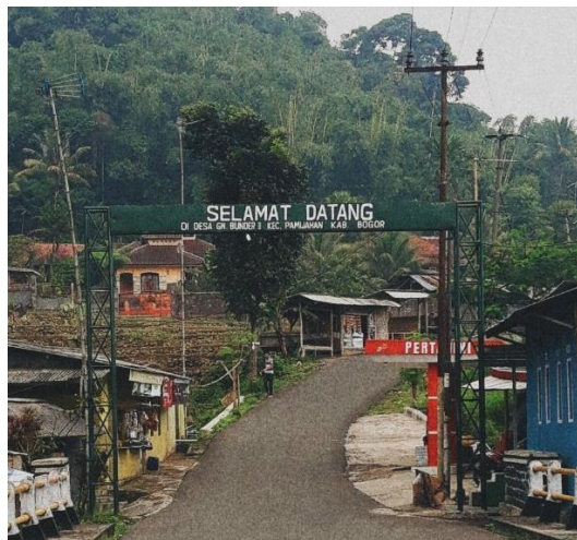
Gambar 1. Desa Tempat Kegiatan

Desa Gunung Bunder 2 merupakan sebuah desa di kecamatan Pamijahan, Kabupaten Bogor, Jawa Barat, yaitu sebuah desa yang terletak dibawah kaki gunung salak. Desa ini berada di selatan kota bogor yang kurang lebih sekitar 25 km jika dari pintu tol bogor, dan sekitar 40 Kilometer dari pusat pemerintahan Kabupaten Bogor, Cibinong. Desa Gunung Bunder 2 berada diketinggian 700 -800 mdpl dengan luas 386.450 Ha. Desa ini terbagi dalam 3 Dusun 7 RW dan 42 RT.