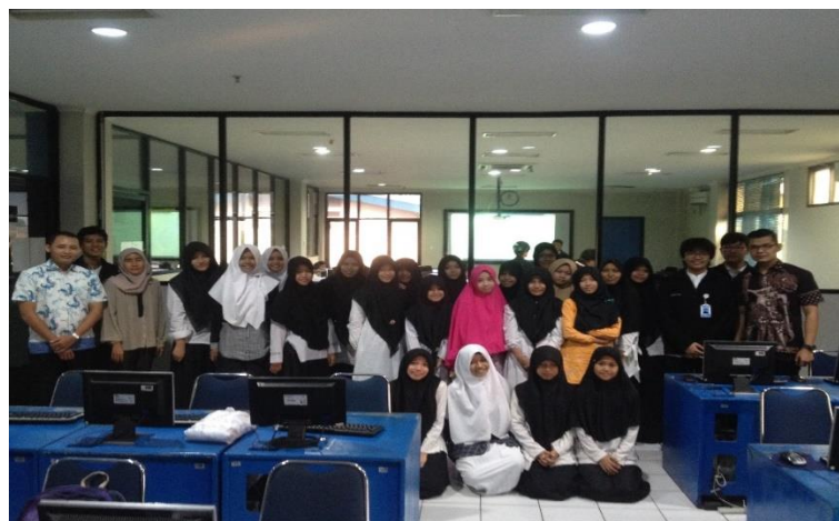
Gambar 6. Foto Bersama dengan Peserta Perempuan dengan Instruktur dan Asisten Instruktur