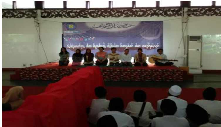
Gambar 2. Pembukaan Acara