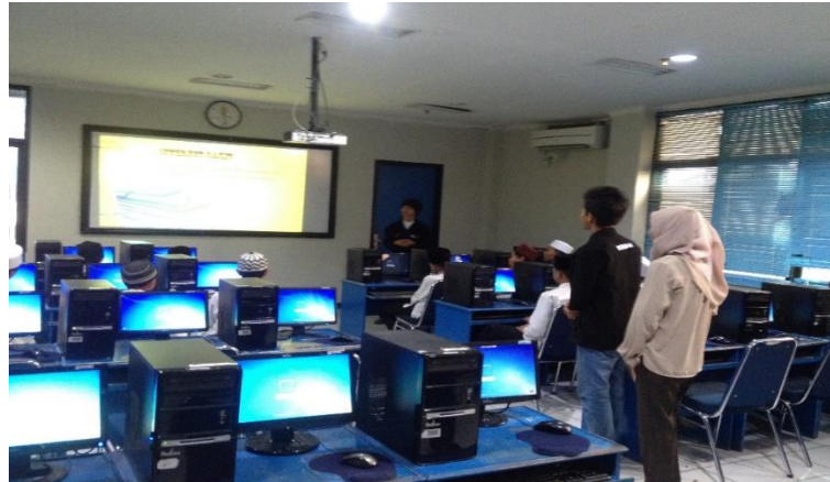
Gambar 4. Penyampaian Materi Pelatihan Internet Sehat