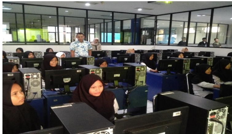
Gambar 5. Pendampingan Asisten Instruktur