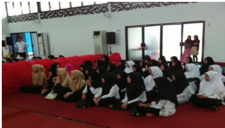
Gambar 3. Peserta Wanita