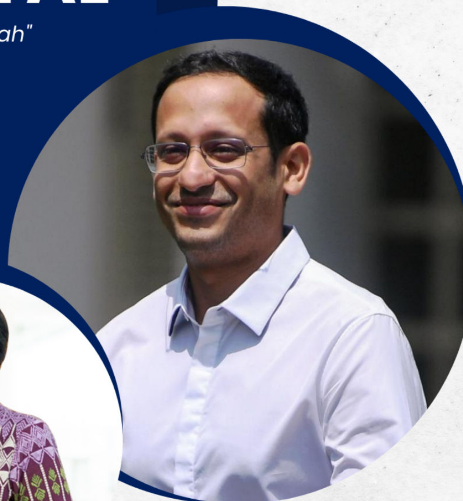
Nadiem Anwar Makarim

Widyaiswara Muda Kementerian Dalam Negeri