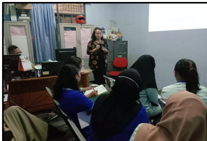
Gambar 3. Dokumentasi Instruktur Sedang Memberikan Materi Pelatihan Abdimas

Para peserta abdimas dengan antusias dan penuh perhatian menyimak materi yang disampaikan oleh tim instruktur dari FEB UBL. Hal ini dikarenakan sebagian besar peserta belum memahami secara mendalam mengenai penerapan strategi komunikasi dalam peningkatan layanan prima. Kegiatan abdimas ditutup dengan sesi tanya jawab dan diskusi interaktif antara peserta dan narasumber. Sebelum acara berakhir, tim dosen abdimas memberikan evaluasi melalui post-test kepada peserta yang berasal dari YKAI guna mengukur peningkatan pemahaman setelah pelatihan. Dokumentasi kegiatan yang menampilkan tim instruktur bersama mahasiswa Program Studi Sekretari FEB UBL serta perwakilan dari Klinik Yadika Petukangan, Jakarta Selatan, dapat dilihat pada Gambar 4 berikut.