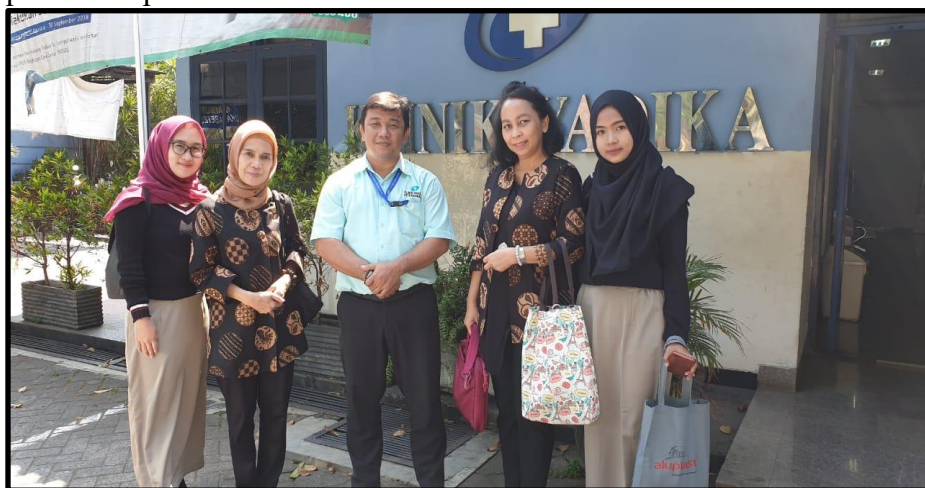
Gambar 4. Dokumentasi Tim Abdimas FEB UBL Bersama Perwakilan Klinik Yadika

Para peserta abdimas dengan antusias dan penuh perhatian menyimak materi yang disampaikan oleh tim instruktur dari FEB UBL. Hal ini dikarenakan sebagian besar peserta belum memahami secara mendalam mengenai penerapan strategi komunikasi dalam peningkatan layanan prima. Kegiatan abdimas ditutup dengan sesi tanya jawab dan diskusi interaktif antara peserta dan narasumber. Sebelum acara berakhir, tim dosen abdimas memberikan evaluasi melalui post-test kepada peserta yang berasal dari YKAI guna mengukur peningkatan pemahaman setelah pelatihan. Dokumentasi kegiatan yang menampilkan tim instruktur bersama mahasiswa Program Studi Sekretari FEB UBL serta perwakilan dari Klinik Yadika Petukangan, Jakarta Selatan, dapat dilihat pada Gambar 4 berikut.