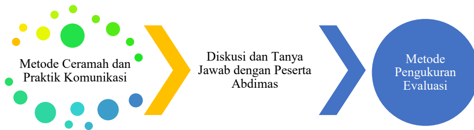
Gambar 1. Metode Kegiatan Abdimas Bagi Tenaga Administrasi Kesehatan Klinik Yadika Petukangan

Pendekatan yang digunakan dalam pelaksanaan kegiatan pengabdian kepada masyarakat (abdimas) bersama mitra Klinik Yadika Petukangan meliputi: (1) Metode ceramah, yang digunakan untuk menyampaikan materi dan memberikan pemahaman kepada peserta; dan (2) Metode evaluasi pengukuran, yang dilakukan untuk menilai efektivitas serta hasil pelaksanaan kegiatan abdimas tersebut. (Hariyani, 2025). Gambaran mengenai metode pelaksanaan kegiatan abdimas dalam proses pendampingan peserta dapat ditunjukkan melalui diagram berikut: