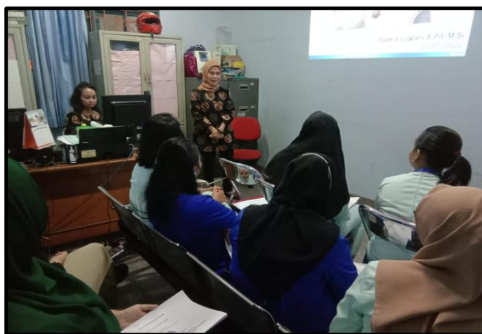
Gambar 2. Suasana Kegiatan Abdimas Untuk Mitra Klinik Yadika Petukangan