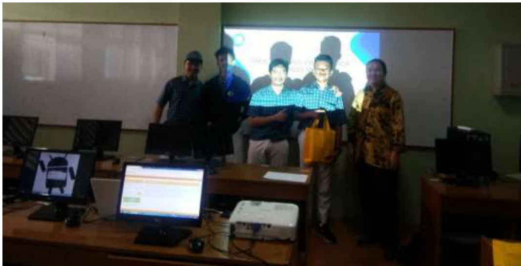
Gambar.5 Pemberian penghargaan kepada tim terbaik