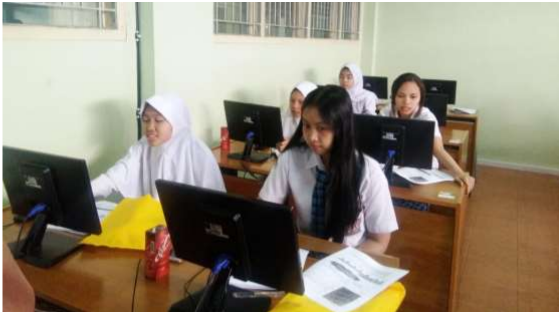
Gambar.1 Suasana pelatihan 1

Setiap tim mempunyai sebuah perusahaan yang bergerak di bidang penjualan minuman. Setiap perusahaan diberikan modal berupa 3 buah toko dengan luas masing-masing toko 100m 2 , produk jadi jus apel 10.000 unit/toko, produk jadi jus jeruk 10.000 unit/toko, dan produk jadi jus melon 10.000 unit/toko. Setiap perusahaan diberikan kondisi awal yang sama mengenai stok awal, dimensi produk, harga produk jadi, harga produk mentah, harga jual awal produk, luas awal toko, biaya sewa toko, biaya overflow toko, area awal gudang, biaya sewa gudang, biaya overflow gudang, biaya pengiriman gudang ke toko, biaya pengiriman berdasarkan jarak, dan biaya per pengiriman. Dari kondisi dan modal awal perusahaan, para peserta belajar mengatur strategi penjualan dan stocking produk untuk bisa meningkatkan penjualan dan mendapat keuntungan yang banyak.