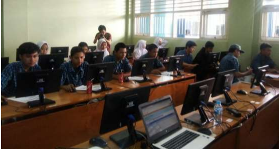
Gambar.2 Suasana pelatihan 2

Penyampaian materi modul warehouse dan production dari game simulasi MonsoonSIM dilakukan pada sesi keempat. Dilanjutkan dengan simulasi kedua selama 18 hari virtual.