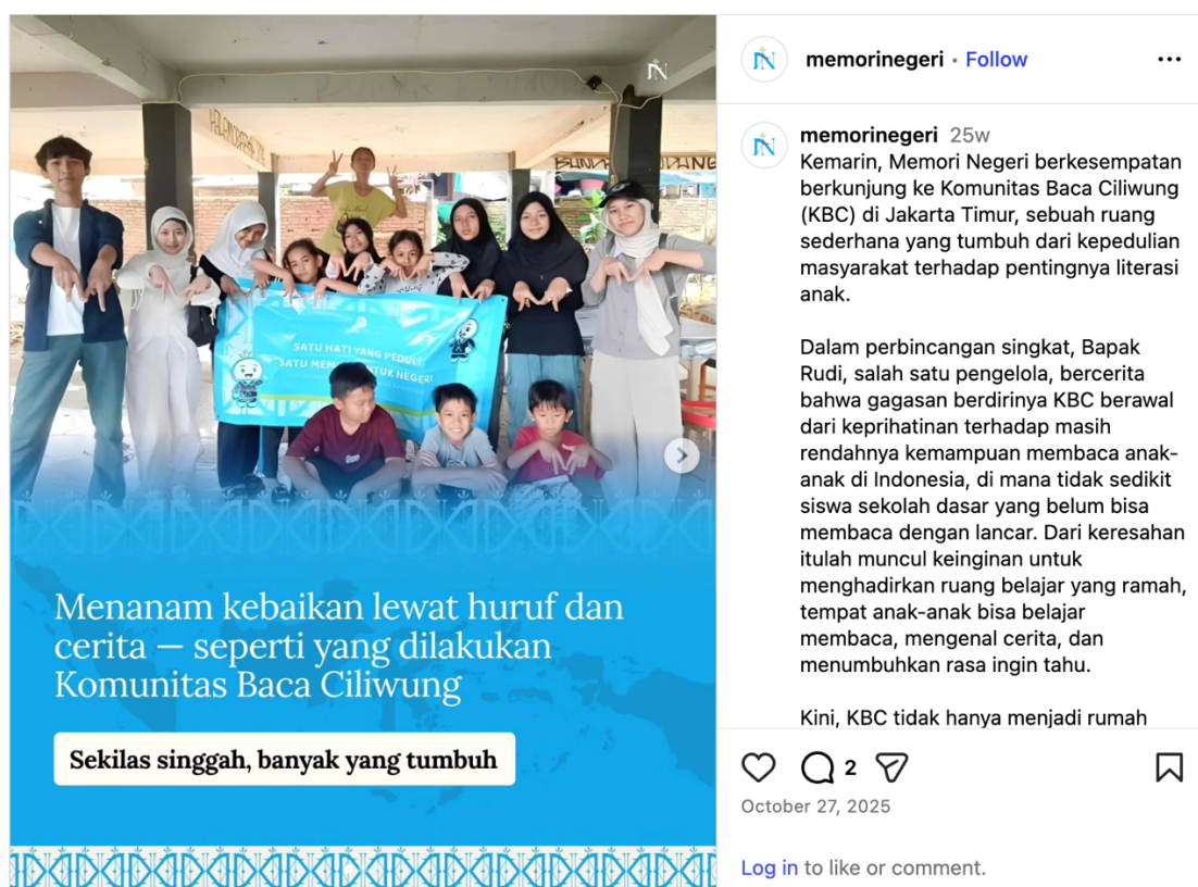
Gambar 1. Kegiatan Komunitas Baca Ciliwung

Kolaborasi dengan Media Massa. Selain media digital, komunitas juga aktif menjalin hubungan dengan media massa untuk memperluas jangkauan komunikasi. Kolaborasi ini dilakukan melalui publikasi kegiatan, wawancara, dan peliputan isu lingkungan. Penelitian Wang dan Jiang (2025) menunjukkan bahwa media massa memiliki pengaruh signifikan dalam membentuk persepsi risiko masyarakat. Framing media terhadap suatu bencana dapat mempengaruhi bagaimana masyarakat memahami tingkat ancaman dan urgensi tindakan mitigasi. Oleh karena itu, media relations menjadi strategi penting dalam mengelola narasi publik.