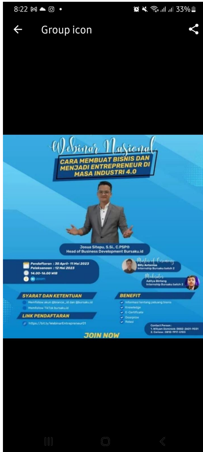
Flyer Seminar Nasional