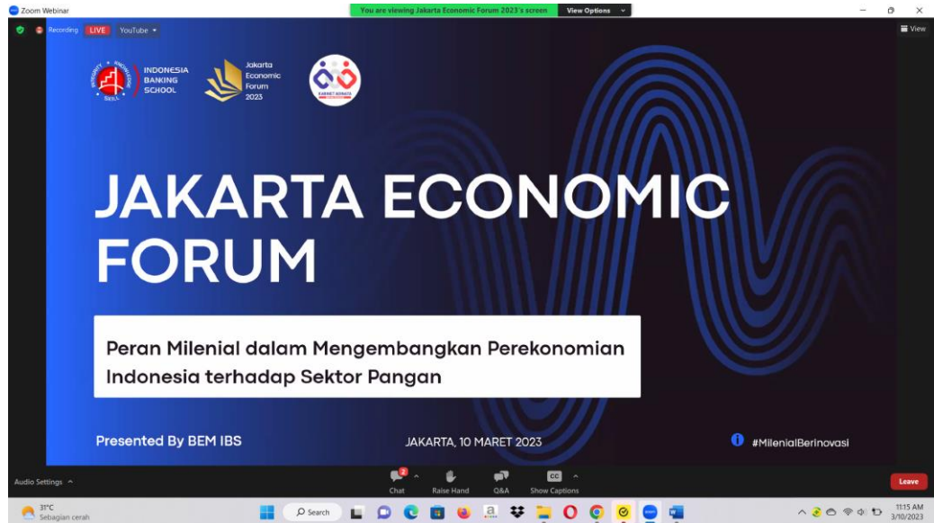
Pembukaan Seminar Nasional Jakarta Economic Forum