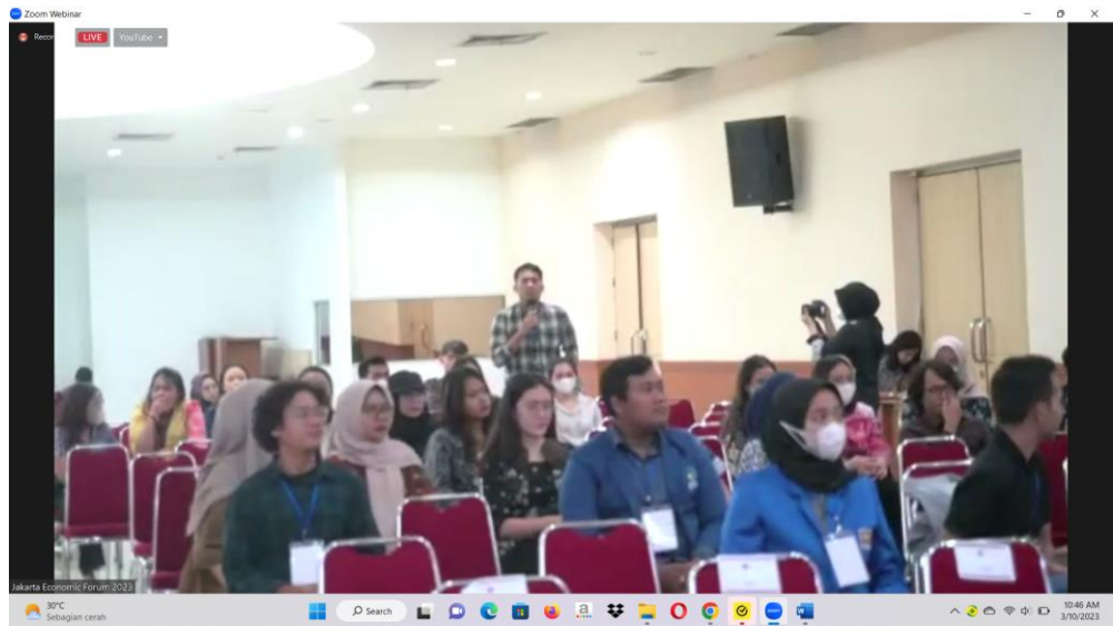
Suasana Seminar Nasional Secara Offline