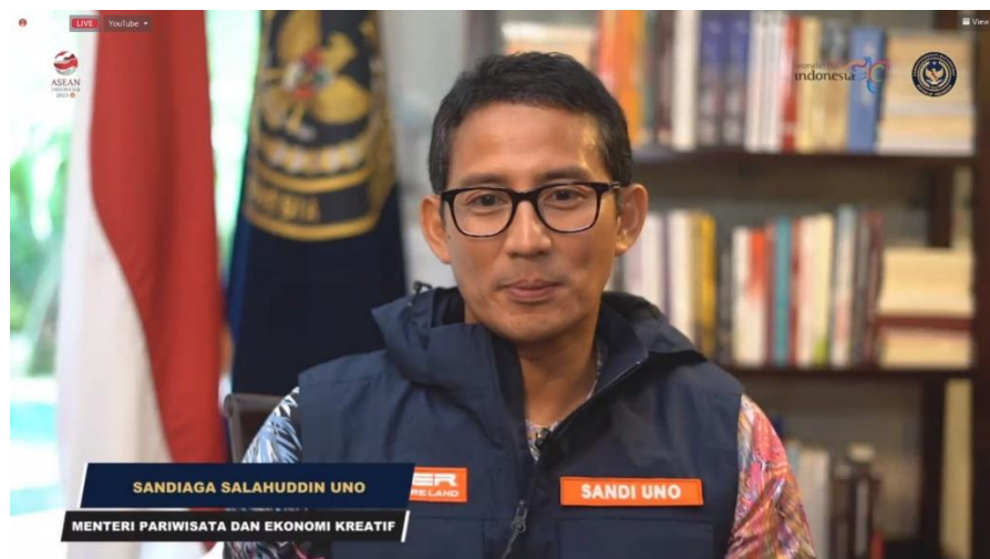
Opening Speech Bapak Sandiaga Uno Pada Seminar Nasional