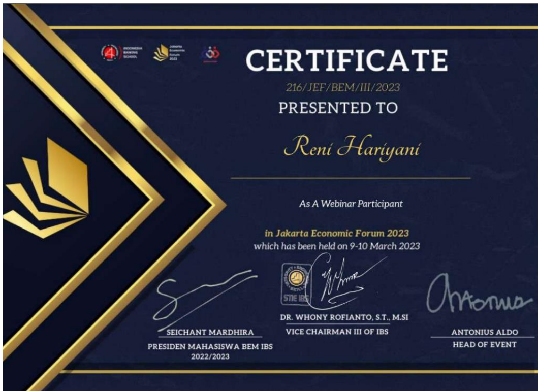
Sertifikat Peserta (Reni Hariyani)