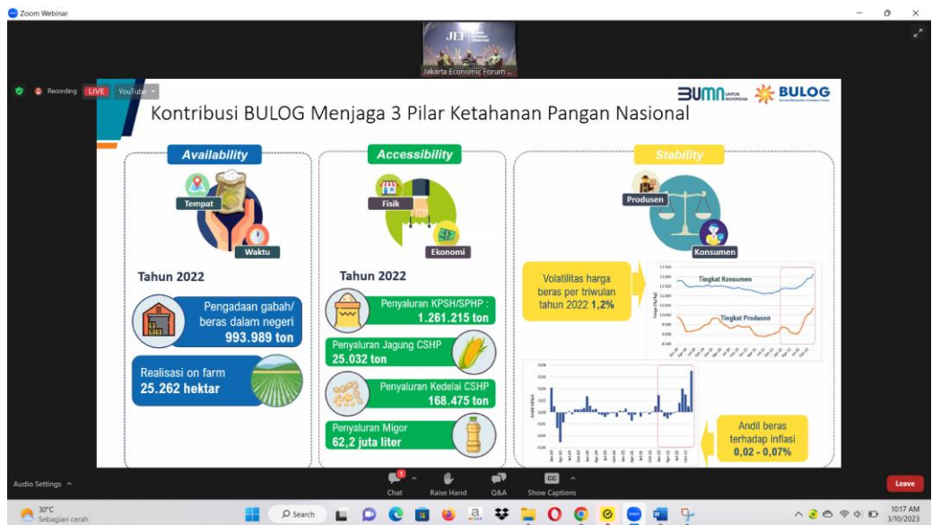
Materi Seminar Nasional