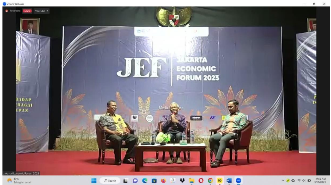
Narasumber Seminar Nasional