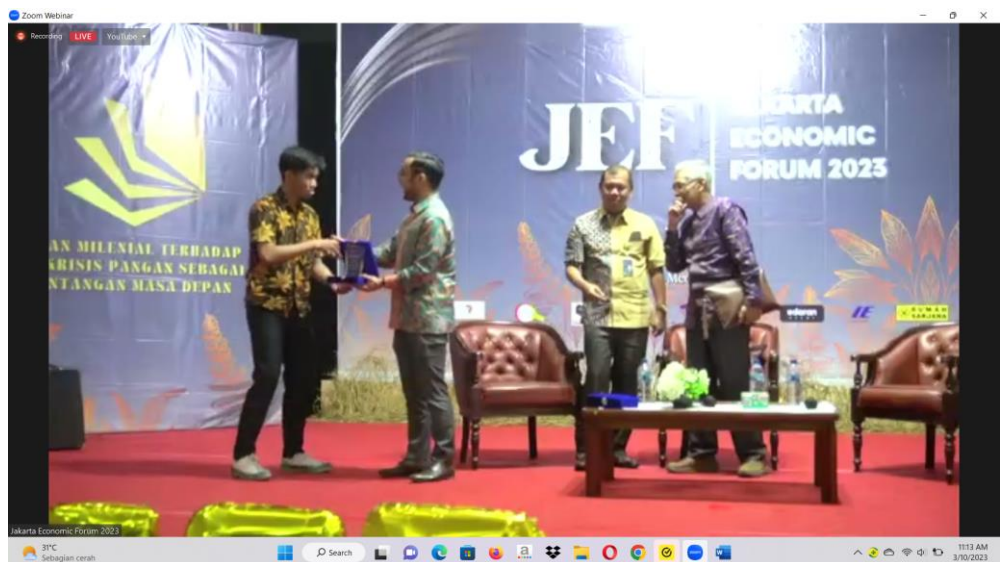
Penyerahan Cenderamata Kepada Narasumber