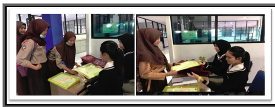
Gambar 1. Registrasi Peserta Abdimas di Laboratorium Komputer

Setelah diberikan pelatihan dengan metode ceramah dilanjutkan dengan pemberian praktik penggunaan aplikasi zahir accounting dalam menyusun laporan keuangan. Praktik pemanfaatan zahir accounting meliputi semua modul yaitu pembuatan database perusahaan, setting saldo awal akun, pembuatan database customer , database supplier, database persediaan barang dagang, transaksi pembelian, transaksi penjualan, transaksi retur, sampai dengan ouput hasil laporan keuangan. Penyusunan laporan keuangan dengan menggunakan zahir accounting dapat diterima dengan mudah oleh para peserta, karena Bahasa yang ada dalam aplikasi tersebut adalah Bahasa Indonesia. Selain itu peserta merasakan manfaat dari proses siklus akuntansi yang dapat dilakukan dengan cepat dan tepat menggunakan bantuan pemanfaatan perangkat lunak zahir accounting. Suasana pemberian materi dapat dilihat pada gambar 2. Pelatihan dilanjutkan dengan sesi tanya jawab diskusi, kemudian pemberian kuesioner untuk evaluasi kegiatan pelatihan abdimas serta diakhiri dengan pemberian cinderamata kepada perwakilan sekolah (gambar 3).