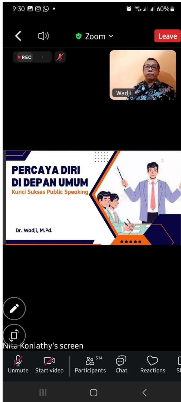
Narasumber 1 Menyampaikan Materi Seminar