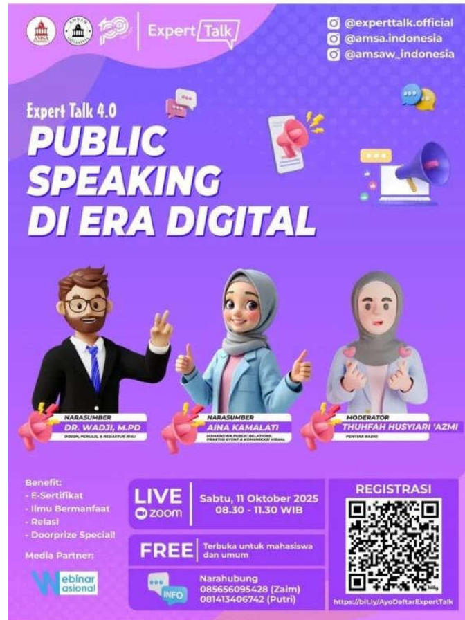
Flyer Info Seminar Nasional Public Speaking di Era Digital