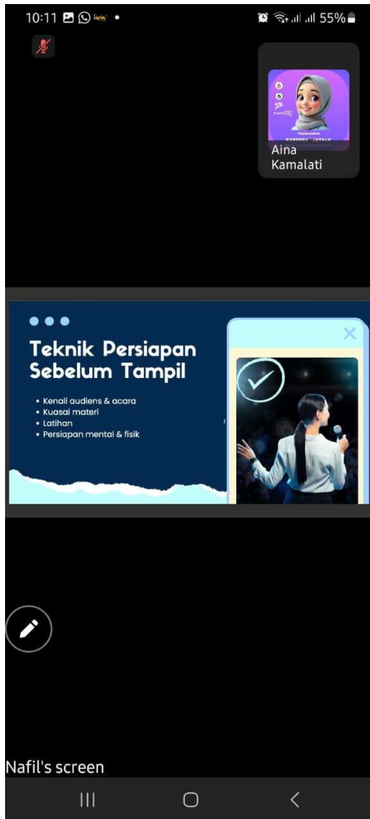
Penyampaian Materi Oleh Narasumber 2