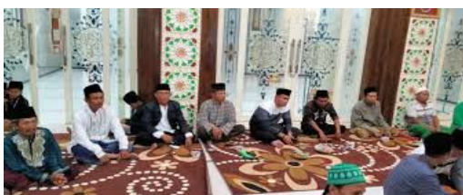
Gambar 3 : aktivitas pelatihan komunikasi