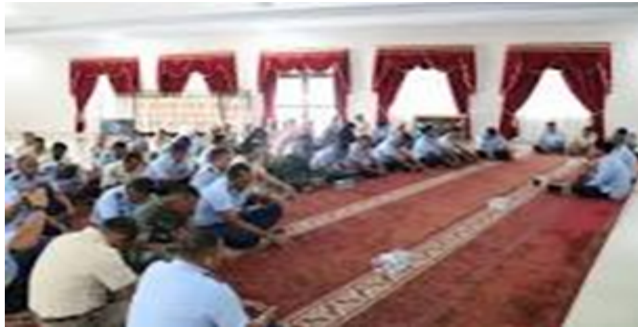
Gambar 1: kehadiran remaja lingkungan RW 26 dalam ceramah agama