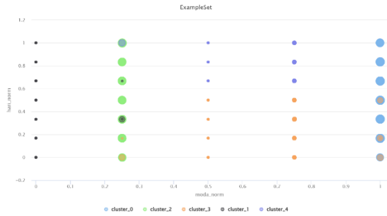
Gambar 10. Visualisasi Scatter Plot

Visualisasi pada Gambar 10 merupakan hasil scatter plot dari proses klusterisasi dengan enam kluster menggunakan algoritma K-Means . Grafik ini memetakan data berdasarkan variabel moda_norm pada sumbu X dan hari_norm pada sumbu Y, dengan warna yang membedakan tiap kluster dan ukuran titik mewakili jumlah penumpang.