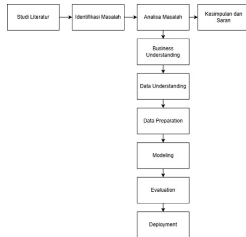
Gambar 1. Tahapan Penelitian

Penelitian ini mengadopsi metodologi Cross Industry Standard Process Model for Data Mining (CRISP-DM) untuk memastikan proses yang terstruktur dan sistematis dalam setiap langkah analisis data. CRISP-DM terdiri dari enam tahap utama, yang diilustrasikan pada Gambar 1 berikut: (Ibrahim & Usino, 2024).