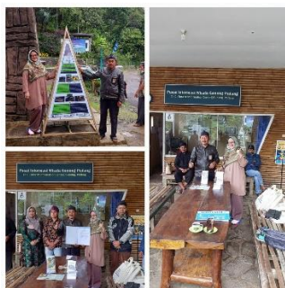
Gambar 8. Serah Terima Atribut Wisata Visual

Penyerahan seluruh atribut wisata ke Situs Megalitikum Gunung Padang, Cianjur, telah dilakukan. Buku panduan, brosure dan infografis sudah digunakan oleh pokdarwis dan sangat bermanfaat, terutama bagi kehadiran turis asing di lokasi Situs. Atribut wisata visual tersebut, telah meningkatkan pengetahuan wisatawan secara umum, mengenai Situs Gunung Padang.