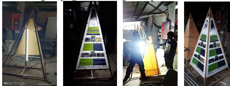
Gambar 7. Infografis wisata 2 bahasa setinggi 2 meter, untuk di lokasi

Infografis ini sudah siap dipasang dilokasi, namun tertunda karena ada penilaian desa wisata terbaik nasional dan sementara tidak diperkenankan ada pihak lain yang masuk saat penilaian. Saat rencana pemasangan bertepatan dengan waktu penilaian.