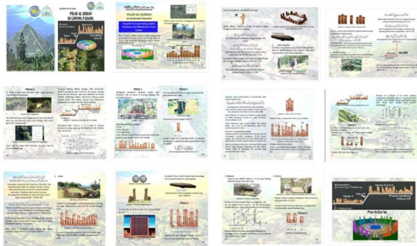
Gambar .3 Isi buku Panduan Pilar Al Quran yang disepakati Mitra Y 74 HA