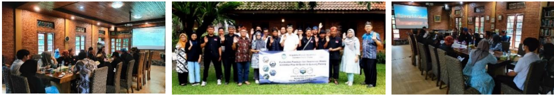
Gambar 10. Pelatihan dan Desiminasi Wisata Pokdarwis di Sekretariat Yayasan 74 HA

Selain pembuatan atribut wisata, dilakukan juga pelatihan dan desiminasi, yaitu desiminasi Pilar Al Quran di Gunung Padang dan Pelatihan Pemandu Wisata dengan teknik Transfer in – Tour dan Transfer Out , bagi Pemandu Wisata di Gunung Padang.