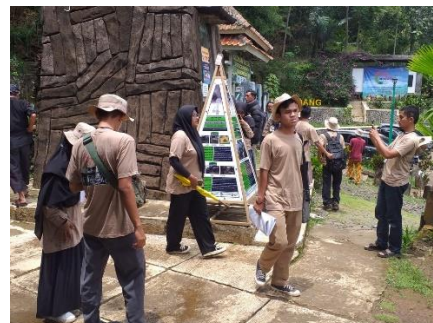
Gambar 9. Pemanfaat Infografis Wisata