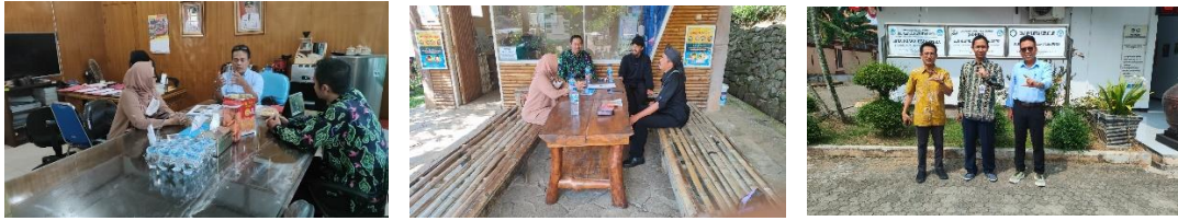
Gambar Perijinan ke Dinas Pariwisata, Cagar Budaya dan Pemandu wisata GP