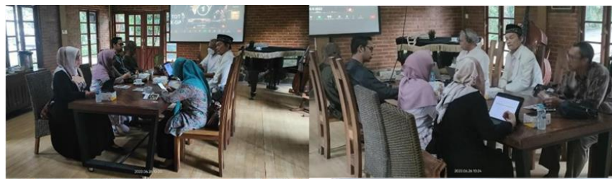
Gambar 2. Diskusr pembuatan buku panduan Pilar Al Quran dengan Mitra Y 74 HA

Buku panduan wisata Religi Pilar Al Quran, karena temuan penelitian, maka harus dikemas dengan populer dan mudah dipahami oleh pemandu wisata dan wisatawan.