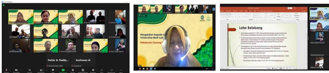
Gambar 1 FGD dengan Mitra

FGD dilakukan dengan media Zoom online, karena situasi masih pandemi. Kelanjutan FGD adalah kunjungan tim PKM untuk melakukan proses perijinan dan pengumpulan data ke Mitra