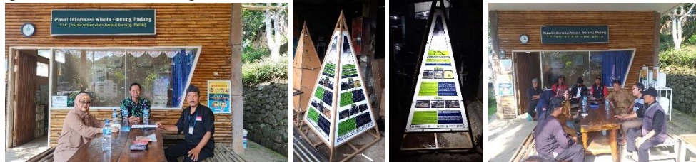
Gsmbar Lokasi Infografis, Klinik Sowan Wisata dan Pusat Informasi Wisata