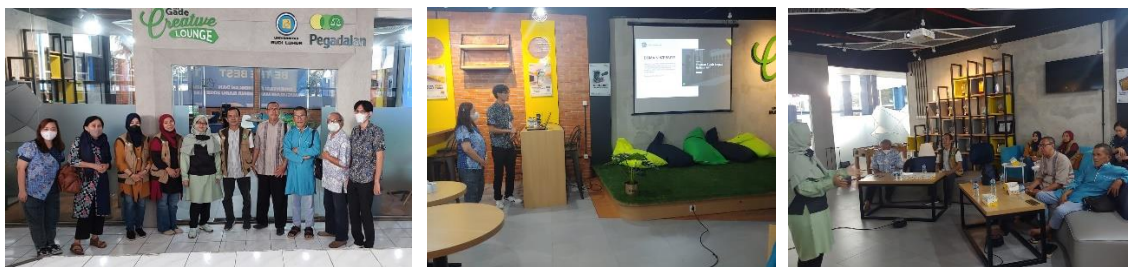
Gambar 11. Pelatihan Pengoperasionalan Website di Univ Budi Luhur

Terakhir adalah kegiatan training operasional website wisata Gunung Padang, kepada Mitra pokdarwis Yayasan 74 Hafizun Alim, dilaksanakan di Universitas Budi Luhur Jakarta.