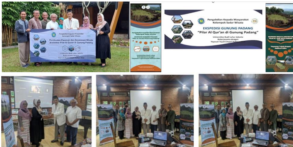
Gambar 4. Pentyerahan atribut wisata ke Mitra Y 74 HA

Untuk memudahkan mitra untuk melakukan ekspedisi dan mengenalkan pengetahuan Pilar Al Quran di Gunung Padang, maka dibuatkan Roll up Benner dan Spanduk.