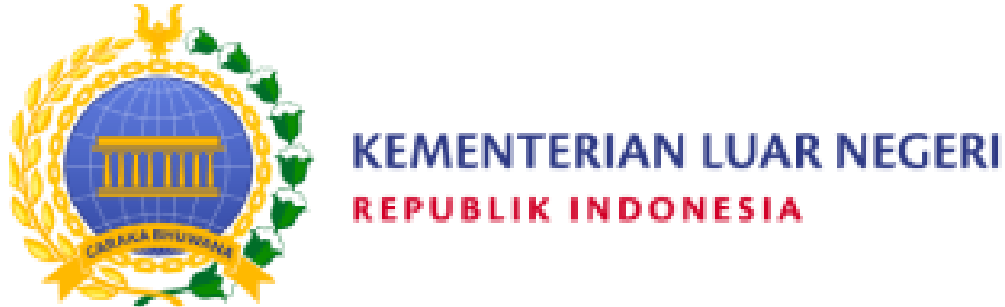
Gambar 2.1 Logo Pusdiklat Kementerian Luar Negeri