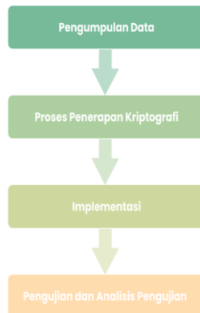
Gambar 1. Penerapan Metode

Metode penelitian digunakan sebagai pedoman dalam pelaksanaan penelitian agar hasil yang dicapai tidak menyimpang dari tujuan yang telah dilakukan sebelumnya. Tahapan penelitian pada penelitian ini dapat dilihat pada gambar 1. berikut :