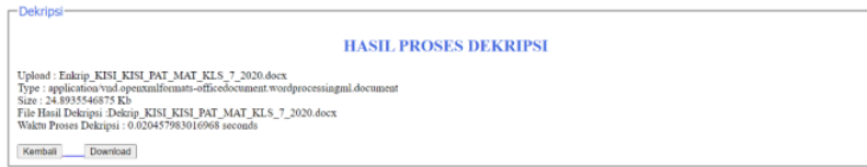
Gambar 7. Hasil Proses Dekripsi

Kemudian setelah admin atau pegawai berhasil mendekripsi, maka akan muncul hasil file yang telah di dekripsi. Berikut Gambar 7 hasil proses dekripsi file :