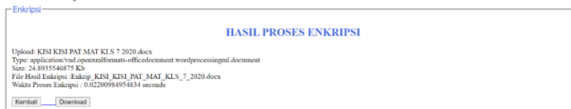
Gambar 3. Hasil Proses Enkripsi

Kemudian setelah admin atau pegawai berhasil mengenkripsi, maka data yang di input akan masuk ke dalam database, file yang di pilih saat inputan form akan masuk ke folder upload dan file akan mengganti nama depan file secara otomatis yaitu Enkrip_namafilename. Berikut dibawah ini Gambar 3 tampilan layar jika file sudah berhasil terenkripsi :