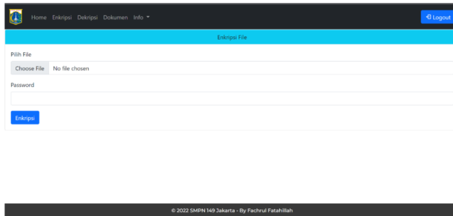
Gambar 2. Menu Form Enkripsi

Enkripsi file dengan cara mengisi form yang sudah disediakan dan memilih file yang akan dienkripsi dan memasukan password minimal 8 karakter. Dapat dilihat pada Gambar 2 dibawah ini :