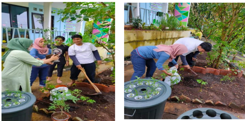
Gambar 3.4 Penanaman dengan Hidroponik