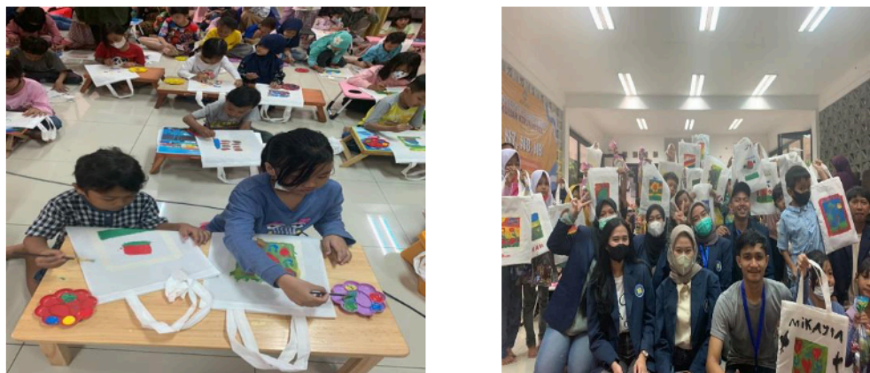
Gambar.3.4 Kegiatan Kreativitas Anak

RTPRA Petukangan Berseri merupakan lahan yang difasilitasi oleh pemerintah untuk kegiatan anak-anak dan masyarakat sekitar. Pengunjung RPTRA hampir rata-rata adalah anak-anak, oleh karena itu kami ingin melakukan kegiatan yang tentunya bermanfaat bagi anak-anak yaitu kegiatan kreativitas anak dengan melukis totebag . Sebagaimana kita tahu bahwa anak-anak mempunyai imajinasi yang tinggi serta sangat baik untuk melatih kreativitas mereka dalam menuangkan imajinasi mereka dalam menggambar serta bermain warna. Selain itu alasan kami memilih totebag adalah agar totebag tersebut dapat digunakan kembali oleh mereka.