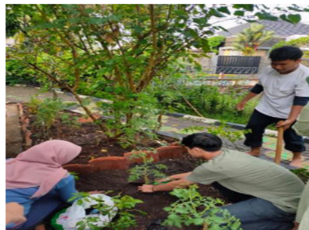
Gambar 3.3 Tanaman sebelum Hidroponik