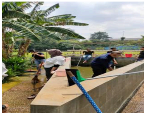
Gambar.3.1.Kolam sebelum di pasang Filter