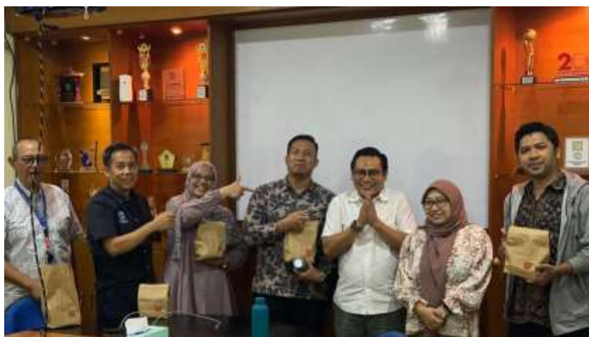
Gambar 6. Foto bersama tim PKM dengan mitra

Kami sebelumnya sudah dapat memprediksi, bahwa tanya jawab yang akan disampaikan akan sangat memakan waktu yang lama, oleh karena itu kami mendurasi khusus untuk tanya jawab selama 1 (satu) jam. Pembahasan yang dilakukan, lebih kepada kami menjelaskan tahap demi tahap, dan dokumen apa saja yang akan diperlukan dalam melakukan pencatatan kinerja. Proses tanya jawab berlangsung secara interaktif, semua pertanyaan yang disampaikan oleh mitra dapat kami jelaskan secara perlahan, rinci, dan detail. Kami selaku tim PKM mengusahakan agar mitra setelah pelaksanaan PKM ini mengerti dan paham. Setelah berakhirnya sesi tanya jawab, maka sampailah di penghujung acara. Sebelum ditutup acara pelaksanaan PKM ini, kami melakukan foto bersama dengan keseluruhan peserta dalam PKM ini, termasuk juga dengan kami.