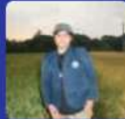
NADAFIL ADZEI Sistem Informasi