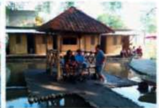
■ Tampak Umbul Kemanten pada kondisi awal sebelum pemataan. Area umbul masih sederhana, dengan fasilitas terbatas dan lingkungan yang belum tertata secara menyeluruh.