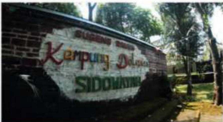
■ Kampung Dolanan Sidowayah ruang edukasi dan budaya yang mengenalkan kembali permainan tradisional kepada generasi muda. Wisata ini berdiri tahun 2016 secara resmi.