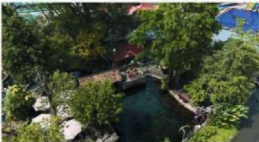
■ Umhul Kemanten merupakan wisata air alami di Desa Sidowayah yang dikenal dengan kejernihan airnya. Dikelilingi pepohonan rindang, tempat ini menjadi ruang rekreasi sekaligus pelestarian sumber mata air desa.