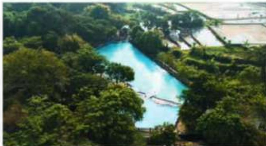
■ Wisata Siblarak adalah kawasan wisata air dan ruang terbuka yang tumbuh dari cerita sejarah lokal. Dahulu dikenal sunyi, kini Siblarak menjadi destinasi favorit warga untuk berwisata dan beraktivitas bersama.