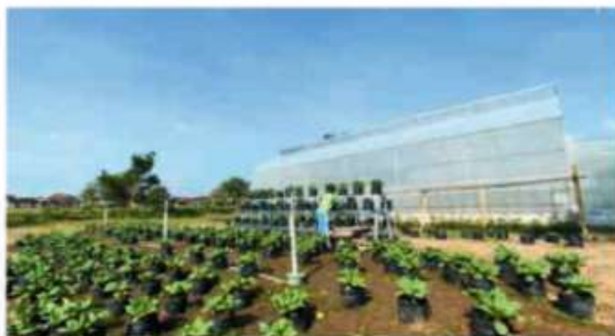
■ Green House Desa Sidowayah dimanfaatkan sebagai sarana pertanian modern dan edukasi. Fasilitas ini mendukung pengembangan tanaman hortikultura serta mendorong kemandirian pangan dan inovasi desa.