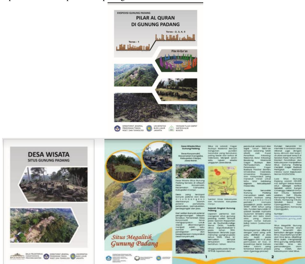
Gambar 5. Produk atribut wisata berupa booklet umum, booklet religi dan brosur

Atribut wisata yang dibuat tersebut, mengakibatkan peningkatan kapasitas atribut wisata bagi pemandu wisata meningkat 100%, dari tidak ada produk menjadi terdapat produk yang komunikatif. Bentuk produk wisata dapat dilihat pada gambar 5 berikut.