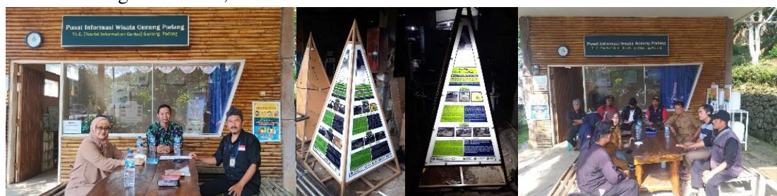
Gambar 4. Lokasi infografis, klinik sowan wisata dan pusat informasi wisata