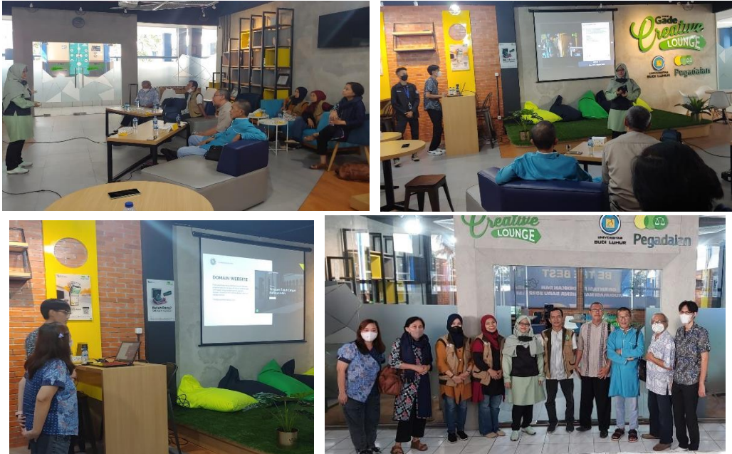
Gambar 8. Pelatihan website Yayasan 74 HA

Pada kesempatan ini tim PKM sekaligus membuat website dan sewa hosting dan domain selama 3 tahun, yang dapat dilihat pada gambar 7. Agar selama 3 tahun masih dalam pantauan tim PKM dan untuk selanjutnya Yayasan 74 HA dapat mengembangkan sendiri websitenya . Untuk itu, tim PKM mengadakan pelatihan website untuk para pengurus Yayasan 74 HA. Harapannya, dengan adanya pelatihan mengoperasikan website dan menyerahkan pengelolaannya pada mitra, maka promosi wisata menjadi lebih luas dan efektif. Pelatihan website dapat dilihat pada gambar 8 berikut ini.