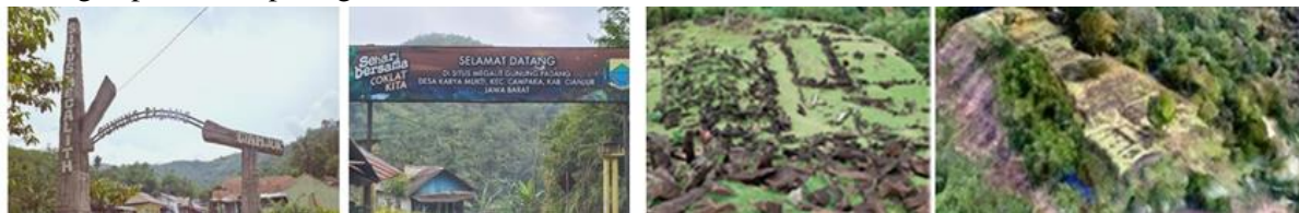
Gambar 1. Situs Gunung Padang Cianjur

Situs Megalitikum Gunung Padang merupakan Situs Cagar Budaya Peringkat Nasional, peninggalan masa megalitikum atau jaman batu besar berbentuk punden berundak yang terletak di Desa Karyamukti, Kecamatan Campaka, Kabupaten Cianjur, Jawa Barat. Situasi situs Gunung Padang dapat dilihat pada gambar 1 berikut ini.