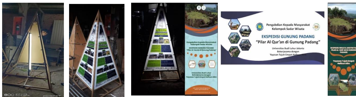
Gambar 6. Produk atribut wisata berupa infografis 2 bahasa, roll banner dan spanduk

Yayasan 74 HA yang sangat peduli dengan Gunung Padang, namun memiliki kendala yaitu belum memiliki website , sehingga tim sekaligus membuat website Yayasan 74 HA dan khususnya Ekspedisi Wisata Religi Gunung Padang. Website ini bertujuan untuk memudahkan Yayasan 74 HA melakukan promosi dan pemasaran dalam menarik wisatawan yang akan melakukan ekspedisi Pilar Al Quran ke Gunung Padang. Salah satu tantangan bagi daerah tujuan wisata dalam masa ini adalah keberadaan sistem informasi daerah tujuan wisata, terutama informasi yang mudah didapatkan pada mesin pencari. Apabila sebuah daerah wisata tidak memiliki website , maka dalam dunia maya kawasan ini tidak terekspos secara maksimal. Salah satu kendala utama yang dihadapi, adalah keterbatasan kemampuan pihak pengelola dalam mempromosikan daerah wisata melalui website .