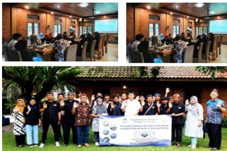
Gambar 3. Pelatihan tour guide dan pilar Al Quran di Djember Venue Bogor

Pelatihan Tour Guide yang diberikan pada sepuluh orang Pemandu Wisata dan Ketua Cagar Budaya Gunung Padang berlangsung efektif dan kondusif. Sasaran 100% dari Pokdarwis mendapatkan tambahan pengetahuana tercapai. Target awal adalah 13 Pokdarwis, namun hanya 10 orang dapat meninggalkan lokasi Wisata, karena yang lain harus ada yg tetap dilokasi.