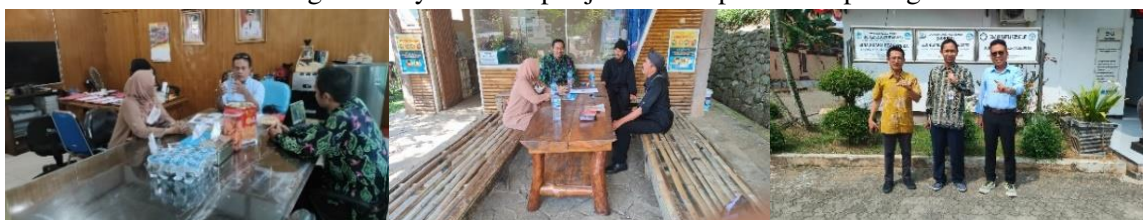
Gambar 9. Perijinan ke Dinas Pariwisata, Cagar Budaya dan pemandu wisata GP

Karena situs megalitikum Gunung Padang ini merupakan situs yang dilindungi sebagai objek Cagar Budaya Jawa Barat, maka perijinan melakukan kegiatan di Situs Megaliticum Gunung Padang cukup ketat. Pokdarwis sangat hati-hati dan benar-benar mastikan bahwa kegiatan ini telah diijinkan oleh dinas Pariwisata dan Cagar Budaya. Proses perijinan ini dapat dilihat pada gambar 9 berikut