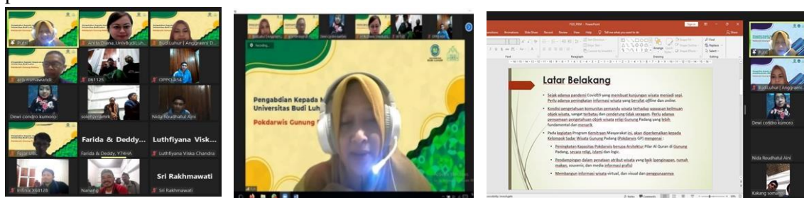
Gambar 2. FGD via zoom dengan mitra

Diketahui dari hasil FGD dengan mitra Pokdarwis Yayasan 74 HA, maupun Pemandu Wisata di Gunung Padang, tidak memiliki buku panduan yang umum maupun yang bersifat religi. Sehingga tim PKM harus menggali potensi desa wisata secara umum, dan khusus untuk membuat buku panduan wisata.