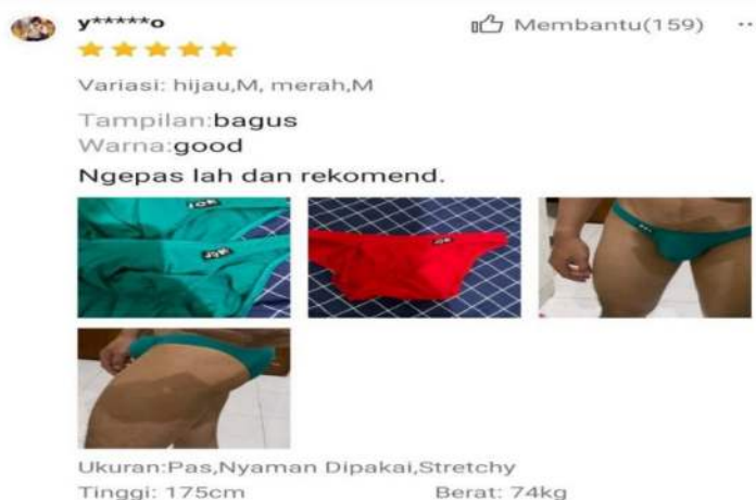
Gambar 2. Foto Testimoni Konsumen 2

Menariknya ulasan produk celana dalam ini mencapai total 1,7 ribu ulasan dari konsumen terdapat beberapa ulasan yang mengandung nilai eksbisionism yang menampilkan video vulgar sekitar mr P mereka dengan produk yang mereka beli dengan durasi singkat. Pada tampilan foto beberapa angle gambar yang menampilkan tonjolan mr P mereka secara jelas dengan produk yang mereka beli sebelumnya. Relasi ini sesuai dengan pikiran ( mind ) tentang nilai kebebasan yang diberikan oleh dunia digital, mereka memikirkan benar tentang ruang kebebasan diri dan ekspresi diri secara seksi di dunia digital.