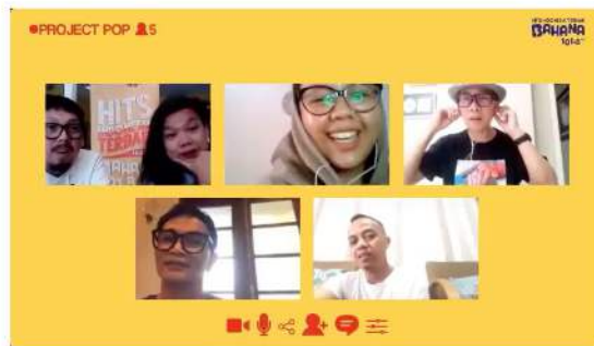
Gambar 3. Proses penyampaian konsep dan beafing

dan dengan adanya aturan yang jelas, maka pegawai tunduk demi tercapainya suatu visi dan misi organisasi.