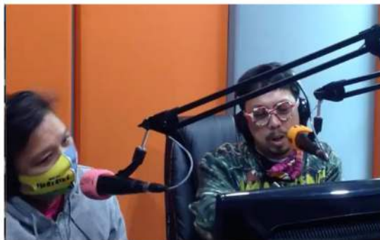
Gambar 2. Saat siaran berlangsung

Kendali Teknis ( technical control ). Kendali ini merupakan kendali dalam penggunaan alat-alat dan teknologi. Contohnya, jika karyawan diberikan sebuah telpon seluler dan diperintahkan untuk menggunakannya dalam pekerjaan mereka, maka mereka dalam kendali teknis karena telpon tersebut. Tujuan menerapkan konsep kendali teknis ini adalah untuk memudahkan setiap anggota mendapatkan informasi dalam bekerjasama agar lebih efektif dan efisien.