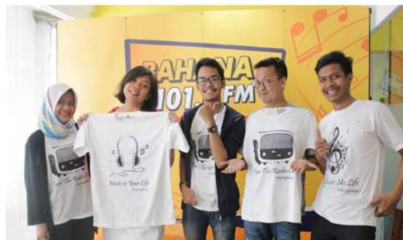
Gambar 4. dokumentasi penyiar dan anak magang

Kendali Konsertif ( concertive control ). Penggunaan hubungan interpersonal dan kerjasama tim sebagai sebuah cara kendali. Ini merupakan bentuk kendali yang paling sederhana karena mengandalkan pada realitas dan nilai - nilai bersama. Dalam organisasi, konsertif, aturan dan regulasi yang tertulis jelas digantikan oleh pemahaman pemaknaan nilai, objektif dan cara-cara penyampaian bersama, sejalan dengan apresiasi yang mendalam untuk “misi” organisasi. Pada kendali konsertif penggunaan hubungan interpersonal dan kerjasama tim merupakan sebuah cara kendali. Hal ini merupakan bentuk kendali yang paling sederhana karena mengandalkan pada realitas dan nilai-nilai bersama. Agar suatu organisasi lebih maju maka nilai keterbukaan perlu diterapkan oleh seluruh anggota organisasi. Dengan adanya keterbukaan berbagai masalah dapat diselesaikan dengan cepat dan baik.