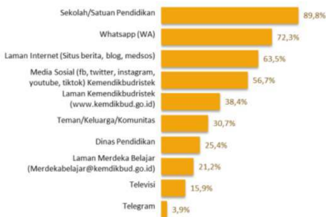
Gambar 3. Peringkat Kanal Sumber Informasi Kemendikbudristek