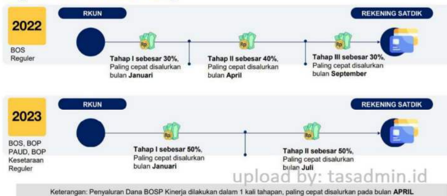
Gambar 1. Mekanisme penyaluran dana bos reguler

Mekanisme Penyaluran Dana BOS Reguler dilakukan secara langsung dari RKUN ke rekening satuan pendidikan dalam 3 tahap. Mulai tahun 2023, penyaluran Dana BOSP Reguler dilakukan dalam 2 tahap