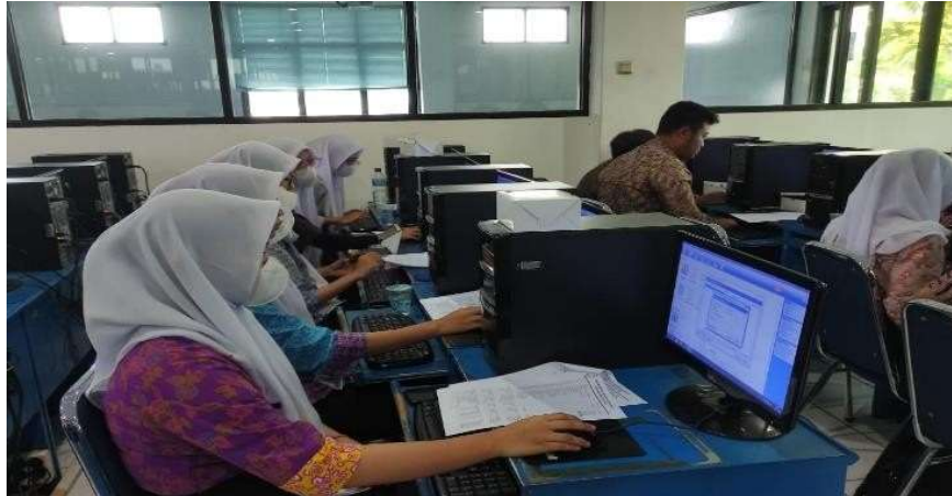
Gambar 3. Praktikum Input Transaksi

Praktikum selesai dilanjutkan dengan tahap akhir yaitu penyerahan souvenir dan sambutan dari peserta atas pelatihan yang dilakukan dengan memberikan kesan dan pesan. Evaluasi yang dilakukan atas pelatihan yang dilakukan berupa pemberian pretest pada sesi awal pelatihan dan post test sebelum penutupan kegiatan yaitu 2% peserta sangat memahami Zahir dan 17% memiliki pemahaman baik dan 81% tidak memahami mengenai Zahir dalam penginputan transaksi maupun penggunaan software Zahir. Setelah diadakan pelatihan ada peningkatan sangat mengerti 12%, mengerti 85% dan tidak mengerti 3%. Peserta juga cukup antusias mempelajari Zahir dikarenakan penggunaannya lebih mudah dan tampilannya menarik.