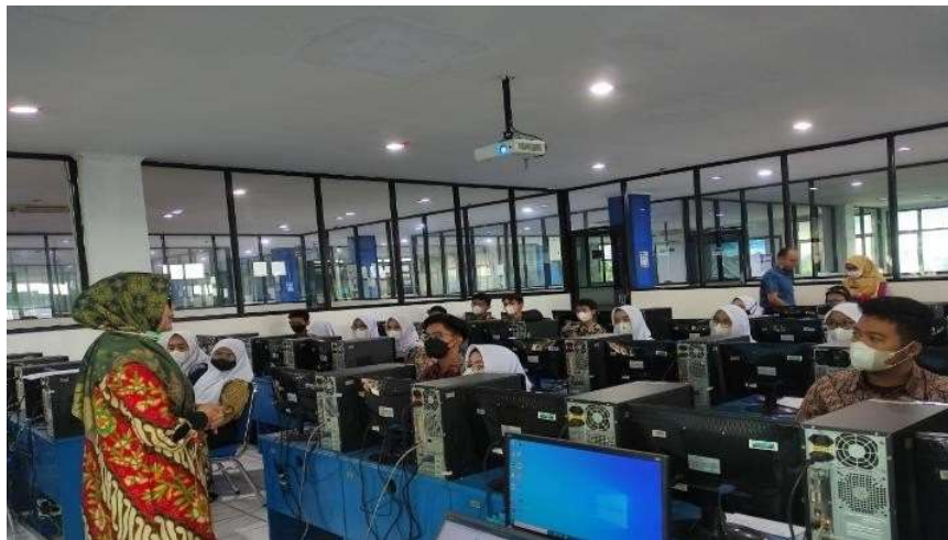
Gambar 2. Pemaparan Materi Pengenalan Aplikasi Zahir

Kegiatan awal yaitu pembukaan yang dilakukan oleh sambutan ketua Tim Pengabdian Masyarakat dan perwakilan guru dari SMK Triguna 1956. Para peserta dijelaskan manfaat pelatihan, materi yang akan diberikan hingga jadwal acara. Setelah kegiatan awal selesai dilanjutkan dengan kegiatan inti yaitu pengenalan aplikasi Zahir Accounting manfaat dan kelebihan yang dimiliki, perbedaannya dengan aplikasi komputer lain seperti MYOB dan Accurate .