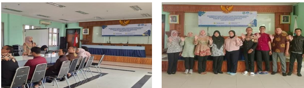
Gambar 1. Kegiatan Sosialisasi Implementasi Digitalisasi Administrasi

Langkah awal dalam implementasi E-Governance adalah menciptakan dan melaksanakan sistem layanan administrasi berbasis digital [14] [15]. Meskipun sistem ini telah tersedia, perlu dioptimalkan pelaksanaannya oleh Aparat Kantor Kecamatan Menteng, antara lain dengan melakukan sosialisasi secara berkelanjutan. Kegiatan Sosialisasi Administrasi Digital dilaksanakan pada tanggal 31 Juli 2025, bertempat di Aula Kantor Kecamatan Menteng, Jakarta Pusat.