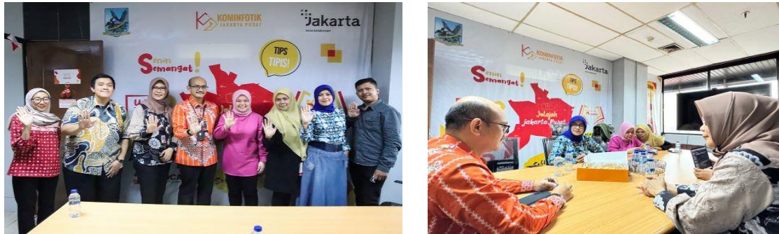
Gambar 2. Forum Group Discussion Optimalisasi Layanan Publik

Kegiatan pengabdian kepada Masyarakat dilanjutkan dengan melakukan diskusi bersama, pada tanggal 21 Agustus 2025 yang dihadiri Tim PKM, Ibu Utari selaku Sekcam dan Tim serta Pejabat Suku Dinas Komunikasi, Informatika dan Statistik Kota Administrasi Jakarta Pusat, di Gedung Kantor Pemerintahan Kota Administrasi Jakarta Pusat, Jl. Tanah Abang No.1, Blok A, Lantai 7. Pada kegiatan ini disepakati kegiatan-kegiatan yang dapat dilakukan untuk optimalisasi layanan Masyarakat, antara lain pendampingan pengelolaan konten website, digitalisasi konten yang dapat mengkomunikasikan kegiatan kantor Kecamatan Menteng dalam pelayanan kepada Masyarakat.