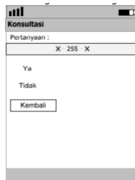
Gambar 12: Rancangan Layar Konsultasi

Pada rancangan konsultasi, pengguna akan disajikan pertanyaan berupa fakta. User diminta