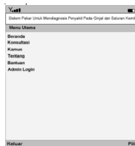
Gambar 11: Rancangan Layar Menu Utama

mudah dapat diakses dan ditambahkan. Untuk menyimpan rule dan kesimpulan terdapat beberapa entitas antara lain entitas pertanyaan digunakan untuk menyimpan fakta-fakta dari basis pengetahuan, entitas jawaban digunakan untuk menyimpan kesimpulan dari serangkaian fakta yang membentuk rule . Pada penelitian ini, basis pengetahuan disimpan dalam 4 (empat) tabel basis data, yaitu tabel pertanyaan, jawaban, jurusan dan arahan. Rancangan layar pengguna ( user interface ) dirancang dengan memperhatikan sisi kenyamanan ( user friendly ). Rancangan aplikasi dibuat dengan tampilan berbasis teks agar dapat ditampilkan pada berbagai jenis perangkat mobile. Rancangan layar menu utama aplikasi terdiri dari menu "Beranda" untuk kembali ke halaman awal, "Konsultasi" untuk melakukan konsultasi, "Kamus" untuk mengakses halaman kamus istilah, "Tentang" untuk mengakses penjelasan singkat terkait aplikasi, menu "Bantuan" untuk mengetahui petunjuk menjalankan aplikasi dan menu "Admin Login" untuk mengakses halaman admin.