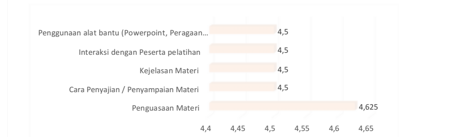
Gambar 5: Hasil Evaluasi Instruktur Pelatihan

Bintaro. Hasilnya menunjukkan bahwa tingkat penerimaan terhadap aplikasi e-Rapor sebesar 79,78%. Hal tersebut menunjukkan bahwa aplikasi e-Rapor secara umum dapat digunakan dan diterima di SMP Mitra Bintaro.