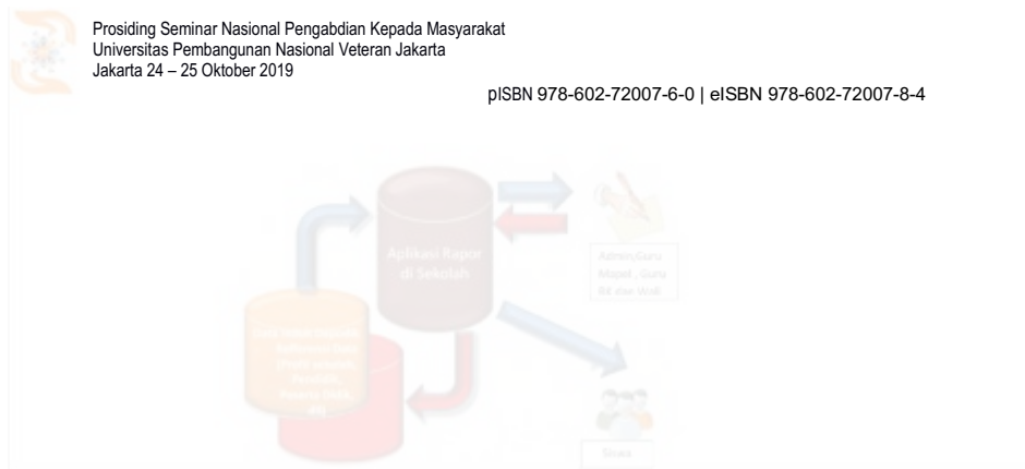
Gambar 2: Alur data dan hubungan aplikasi e-Rapor dengan Aplikasi Dapodik

Di dalam e-Rapor SMP ini dikenal level pengguna (user) yang terdiri atas :