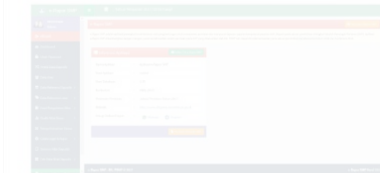
Gambar 1: Tampilan Aplikasi e-Rapor SMP

Proses penilaian hasil belajar peserta didik, baik oleh pendidik maupun oleh satuan pendidikan, akan lebih sistematis, komprehensif, lebih akurat, dan cepat dilakukan apabila didukung dengan penerapan teknologi informasi dan komunikasi. Berkaitan dengan hal tersebut, Direktorat Pembinaan Sekolah Menengah Pertama, Direktorat Jenderal Pendidikan Dasar dan Menengah, Kementerian Pendidikan dan Kebudayaan, telah mengembangkan aplikasi e-Rapor untuk SMP yang terintegrasi dengan Data Pokok Pendidikan (Dapodik). Berdasarkan hasil diskusi dengan kepala sekolah SMP Mitra Bintaro, serta mempertimbangkan kebutuhan dan kondisi di sekolah, diputuskan bahwa SMP Mitra Bintaro mengadopsi sistem penilaian berbasis aplikasi e-Rapor yang dikembangkan oleh Direktorat Pembinaan SMP, Dirjen Pendidikan Dasar dan Menengah, Kemendikbud.