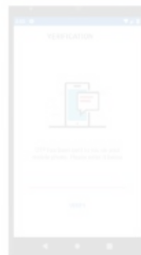
Gambar 8. Permintaan Verifikasi OTP

Saat user berhasil melakukan Login, maka user akan diarahkan ke aktivitas Verifikasi OTP (Gambar 8) yang mana user harus memverifikasi OTP yang dikirimkan lewat SMS. Apabila user salah melakukan verifikasi OTP yang dikirimkan melalui SMS, maka user akan diberitahukan bahwa OTP salah.