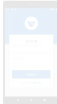
Gambar 5. Tampilan Form Login

Pada bagian ini dijelaskan tampilan layar pada sistem aplikasi android dan web berbasis RESTful API dari tampilan awal hingga tampilan yang akan ditunjukkan baik dari admin, Pelanggan. Gambar 5 merupakan tampilan layar aplikasi saat pertama kali dibuka. Aplikasi akan menampilkan form login yang dapat diisi menggunakan username dan password pengguna.