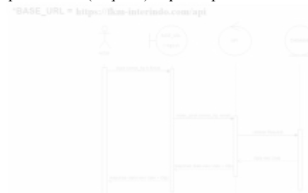
Gambar 2. Diagram Sequence bagian Registrasi

Pada Gambar 1 ditampilkan proses aplikasi mengirimkan sebuah request (permintaan) berupa JSON ( JavaScript Object Notation ) ke API, selanjutnya Web Service mengeksekusi query untuk mengakses basisdata. Setelah proses peng- query -an selesai, Web Service akan mengirimkan data atau response hasil permintaan ( Request ) kepada aplikasi.