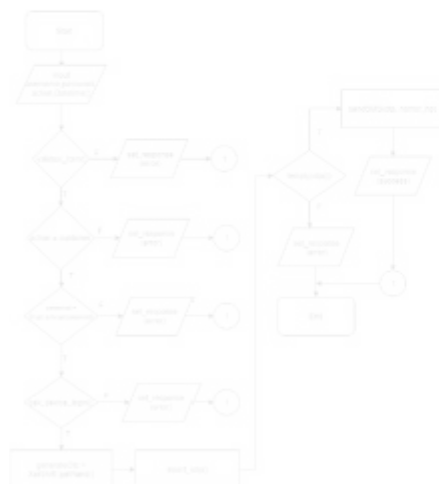
Gambar 4. Flowchart Aplikasi