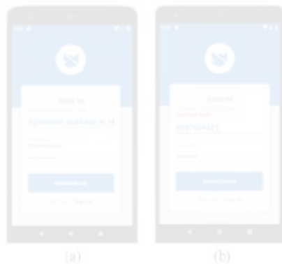
Gambar 6. Pesan Kesalahan Penginputan Username atau Password

RABIT (Jurnal Teknologi dan Sistem Informasi Univrab) Volume 5 No. 2 | Juli 2020 : Hal: 108-116