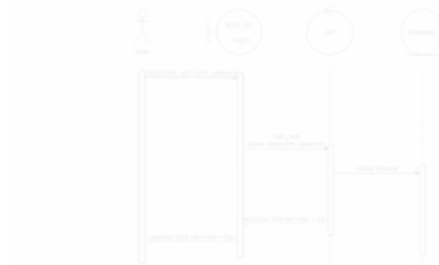
Gambar 3. Diagram Sequence Bagian Login

*BASE_URL = https://api.kas-internds.com/api/test/au/bsn/