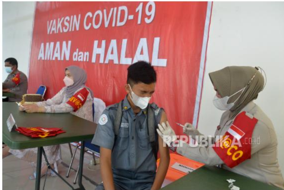
Vaksinasi Covid-19. Epidemiolog memperkirakan gelombang tiga Covid-19 kecil