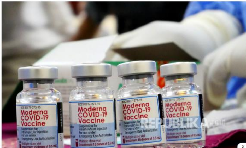
Ampul vaksin Moderna yang digunakan untuk vaksinasi massal Covid-19 dosis tiga di