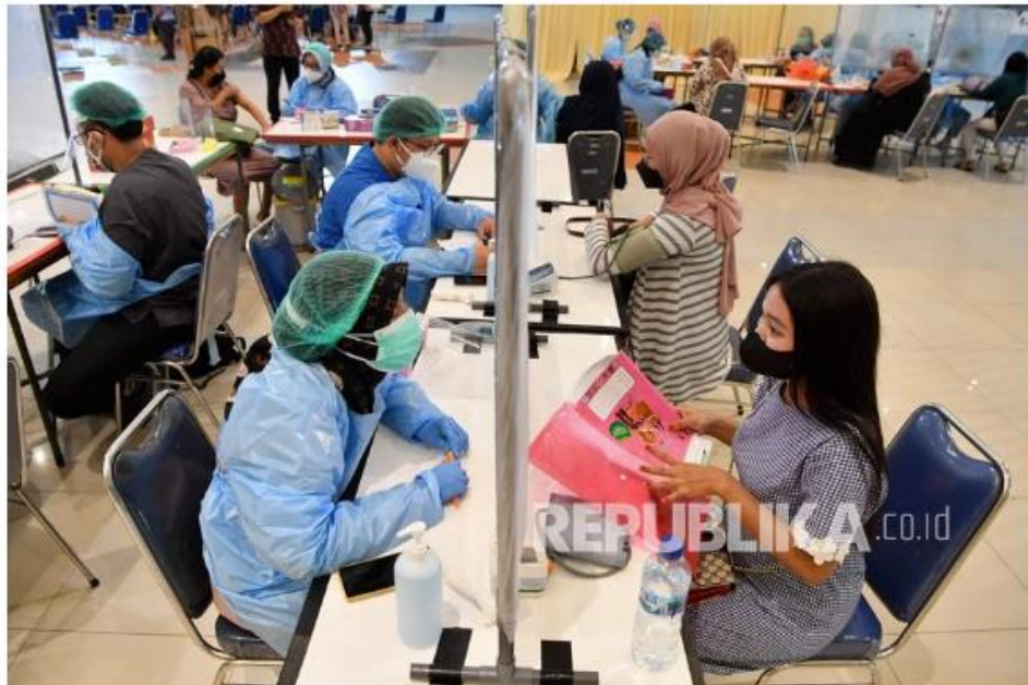
Petugas kesehatan memeriksa kondisi ibu hamil sebelum menerima vaksin Covid-19 saat pelaksanaan vaksinasi Covid-19 untuk ibu hamil di Surabaya, Jawa Timur, Kamis (16/9/2021).