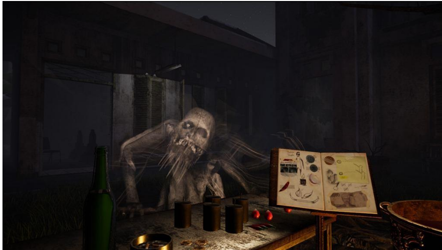
Gambar 3. Dinamis Dalam Bentuk Narasi Cerita dan Interaksi VR

Sedangkan pendekatan dinamis yang ada dalam game ini seperti gambar 3, menggunakan narasi pada alur ceritanya dan bentuk interaksi pada pemainnya, dimana interaksi yang dihadirkan lebih dinamis dengan menggunakan VR. Pemain dapat mengeksplorasi tiap-tiap tingkatan yang ada pada game ini, dengan memberikan suatu bentuk pengalaman dari cerita tertentu.