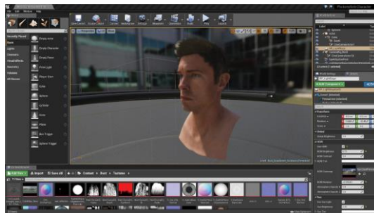
Gambar 2. Mekanik game engine pada game Dreadeye VR

Pendekatan mekanik yang dihadirkan dalam game Dreadeye VR ini, berupa penggunaan perangkat lunak 3D, Unreal game engine yang menggunakan bahasa pemrograman C++ serta perangkat teknologi VR. Hal