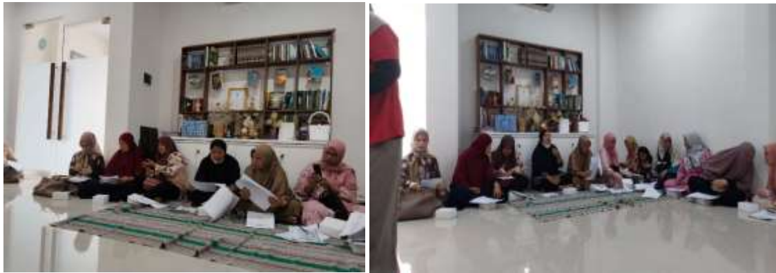
Gambar 2 Pemaparan Materi PKM oleh Tim Dosen FEB Universitas Budi Luhur

Pada sesi terakhir kegiatan, peserta diminta untuk mencatat transaksi sesuai dengan kegiatan bisnis masing-masing, lalu dilanjutkan untuk menyusun laporan keuangan. Evaluasi pada tahap pertama, sesuai dengan indicator keberhasilan kegiatan, dengan hasil: