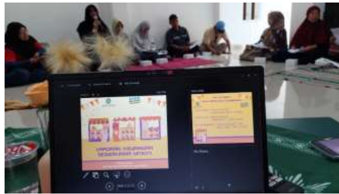
Gambar 1 Peserta PKM : Pencatatan Keuangan, Laporan Keuangan Sederhana

Materi pertama, Tim Pengabdian memberikan materi dengan pembahasan bagaimana melakukan pencatatan keuangan yang baik, tetap sederhana dan mudah dilakukan. Dengan pencatatan ini, peserta juga diberikan pengertian bagaimana memisahkan pengeluaran yang berhubungan dengan usaha, dengan pengeluaran rumah tangga. Sebagian UMKM sejauh ini baru melakukan pencatatan transaksi penjualan saja. Sementara untuk alokasi pengeluaran, masih bercampur dengan pengeluaran rumah tangga. Demikian juga untuk transaksi penjualan. Untuk pemasukan hasil usaha, diakui sebagai pemasukan rumah tangga. Sehingga sulit untuk menentukan laba dari usaha, serta perkembangan usaha. Pada materi pertama ini, peserta juga diminta untuk memisahkan asset-aset yang dimiliki untuk kegiatan usaha mereka, guna menyusun laporan posisi keuangan nantinya.