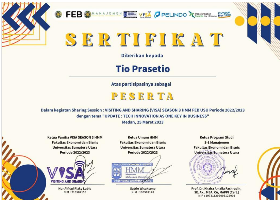
Sertifikat Peserta (Tio Prasetyo)