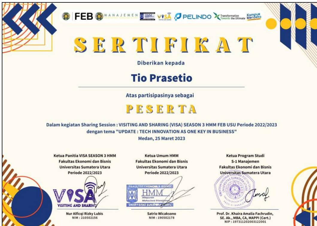
Sertifikat Peserta (Tio Prasetyo)