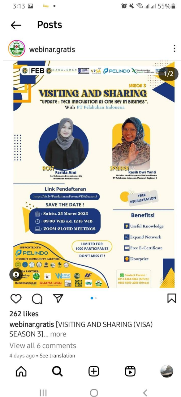
Flyer Seminar Nasional Online