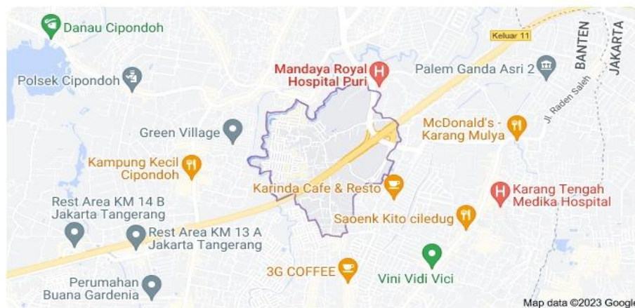
Gambar.1 Lokasi Kegiatan

Melalui penelitian ini, kami berharap dapat memberikan kontribusi positif kepada pengembangan pendidikan karakter dan keterlibatan masyarakat dalam pembentukan masa depan anak-anak Indonesia. Dengan menggarap literasi dan rasa peduli, kita bersama-sama membuka pintu bagi generasi muda yang akan menjadi pemimpin dan pelopor perubahan yang lebih baik bagi anak bangsa ini. Dalam perkembangan selanjutnya, kami akan menguraikan lebih lanjut tentang program ini, metodologi penelitian yang digunakan, dan harapan yang kami bawa dalam melakukan pengabdian kepada masyarakat ini.