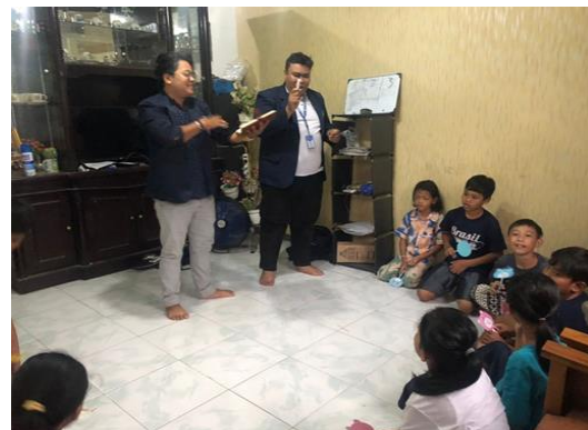
Gambar.3 Kegiatan Penyuluhan