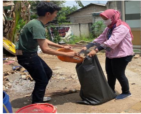
Gambar.2 Kegiatan Edukasi dan Kerja Bakti