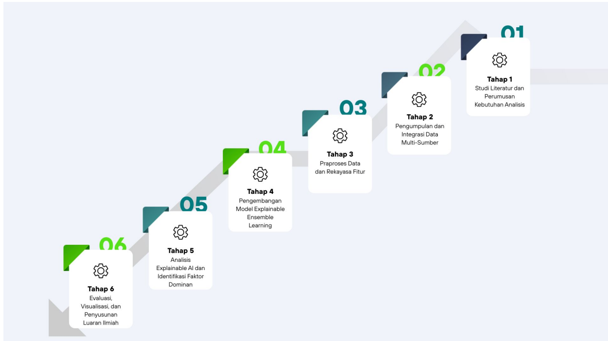
Gambar 2. Tahapan Penelitian

Metode penelitian ini dirancang untuk mencapai tujuan pengembangan pendekatan Explainable Ensemble Learning dalam menganalisis faktor dominan risiko banjir perkotaan berbasis data multi-sumber. Penelitian dilakukan secara bertahap dan sistematis, mulai dari pengumpulan data hingga penyusunan luaran ilmiah, dengan indikator capaian yang jelas pada setiap tahapan, sebagaimana terlihat pada Gambar 2.